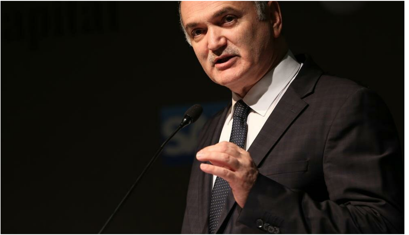
Bilim, Sanayi ve Teknoloji Bakanı Faruk Özlü

Özlü, yazılı açıklamasında, Bakanlığın Fetullahçı Terör Örgütü (FETÖ) ile mücadele kapsamında yürüttüğü faaliyetler hakkında bilgi verdi.