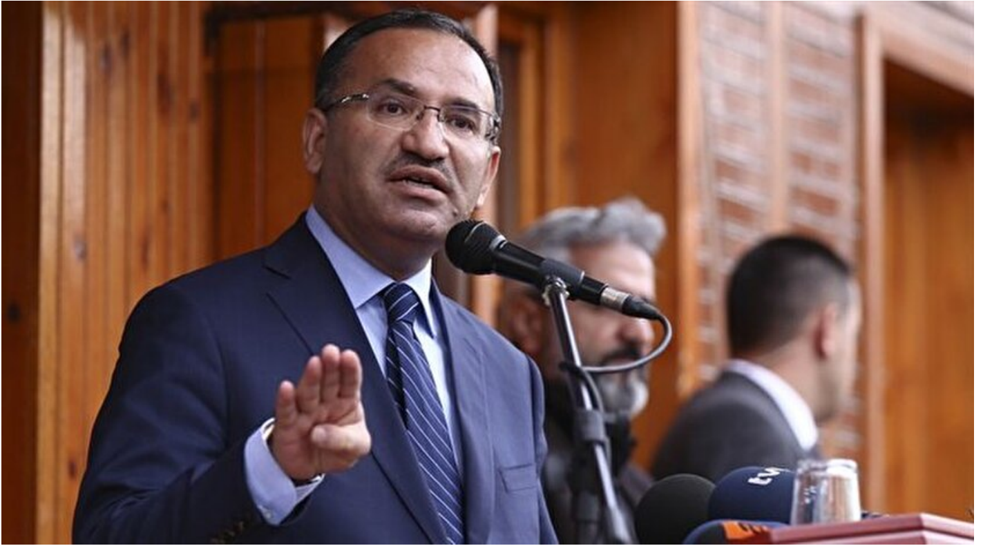
Adalet Bakanı Bekir Bozdağ