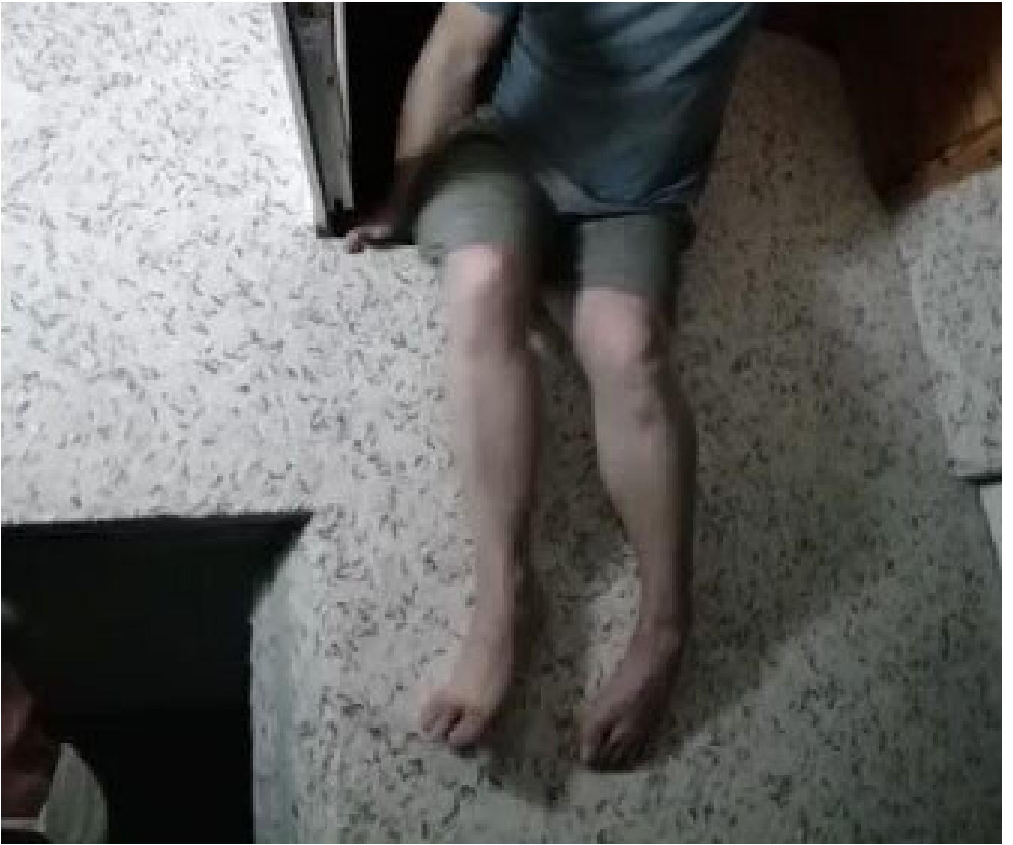
Sorgularının ardından 4 kiři, adliyeye sevk edildi.