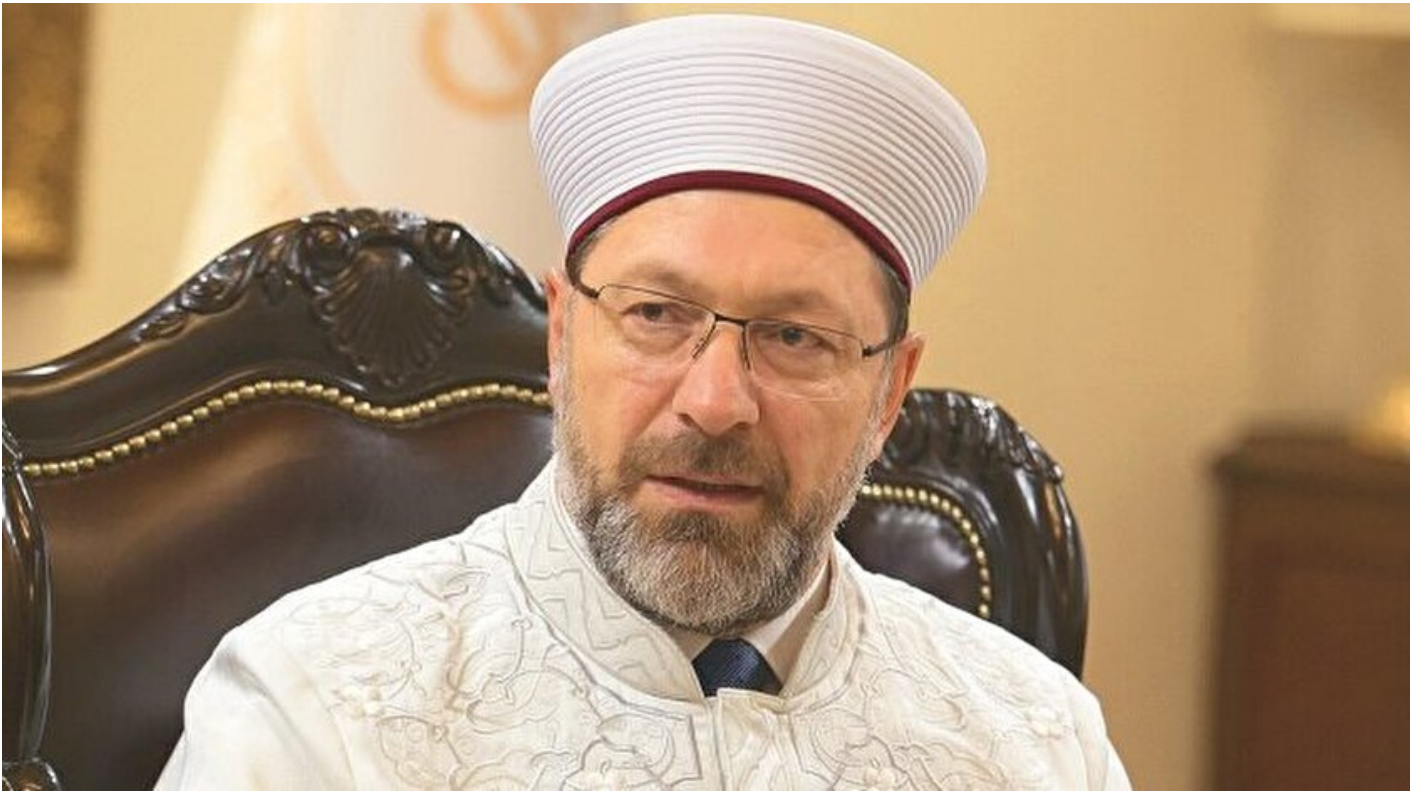
Diyaret İşleri Başkanı Ali Erbaş