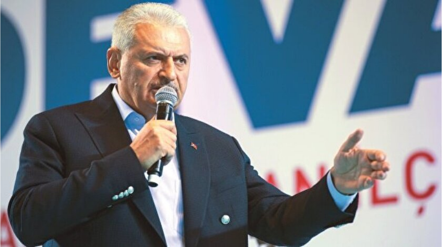
AK Parti Genel Başkanvekili ve Başbakan Binali Yıldırım

Haber Merkezi · 25 Eylül 2017, 04:00 · Yeni Şafak