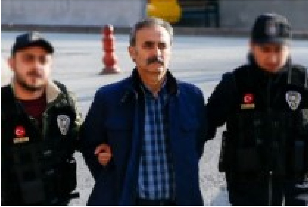
'Kozmik Oda' hakim ve savcisina FETÖ'den hapis cezası