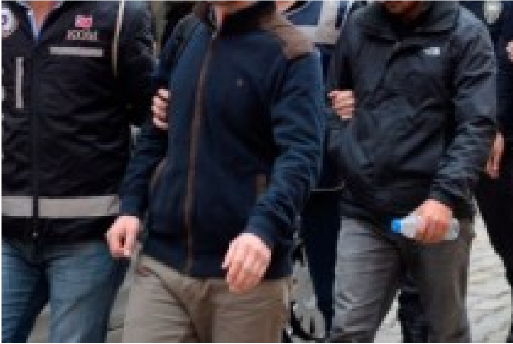
Erzincan merkezli 4 ilde FETÖ operasyonu: Çok sayıda gözaltı