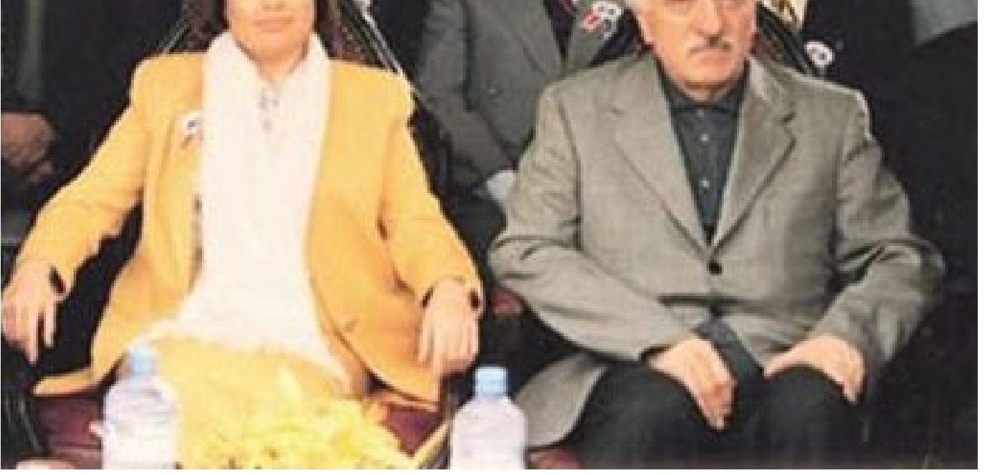
Tansu Çiller ve Fetullah Gülen