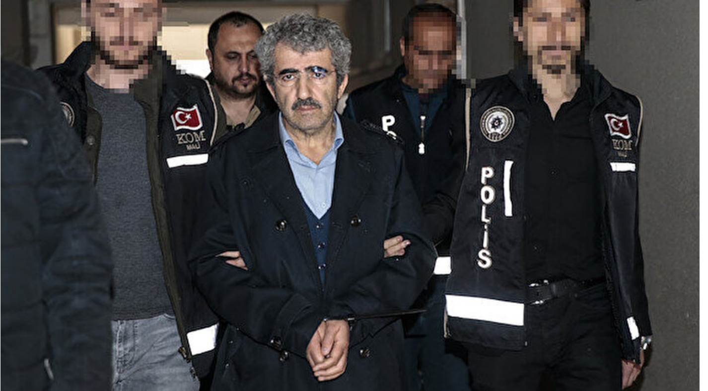
Eski ÖSYM Başkanı Ali Demir.

Haber Merkezi · 06 Mayıs 2019, 15:25 · Son Güncelleme: 06 Mayıs 2019, 15:28 · Yeni Şafak