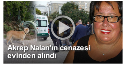
Akrep Nalan'ın cenazesi evinden alındı

Etiketler : abdulhamit gül,adalet bakanı,