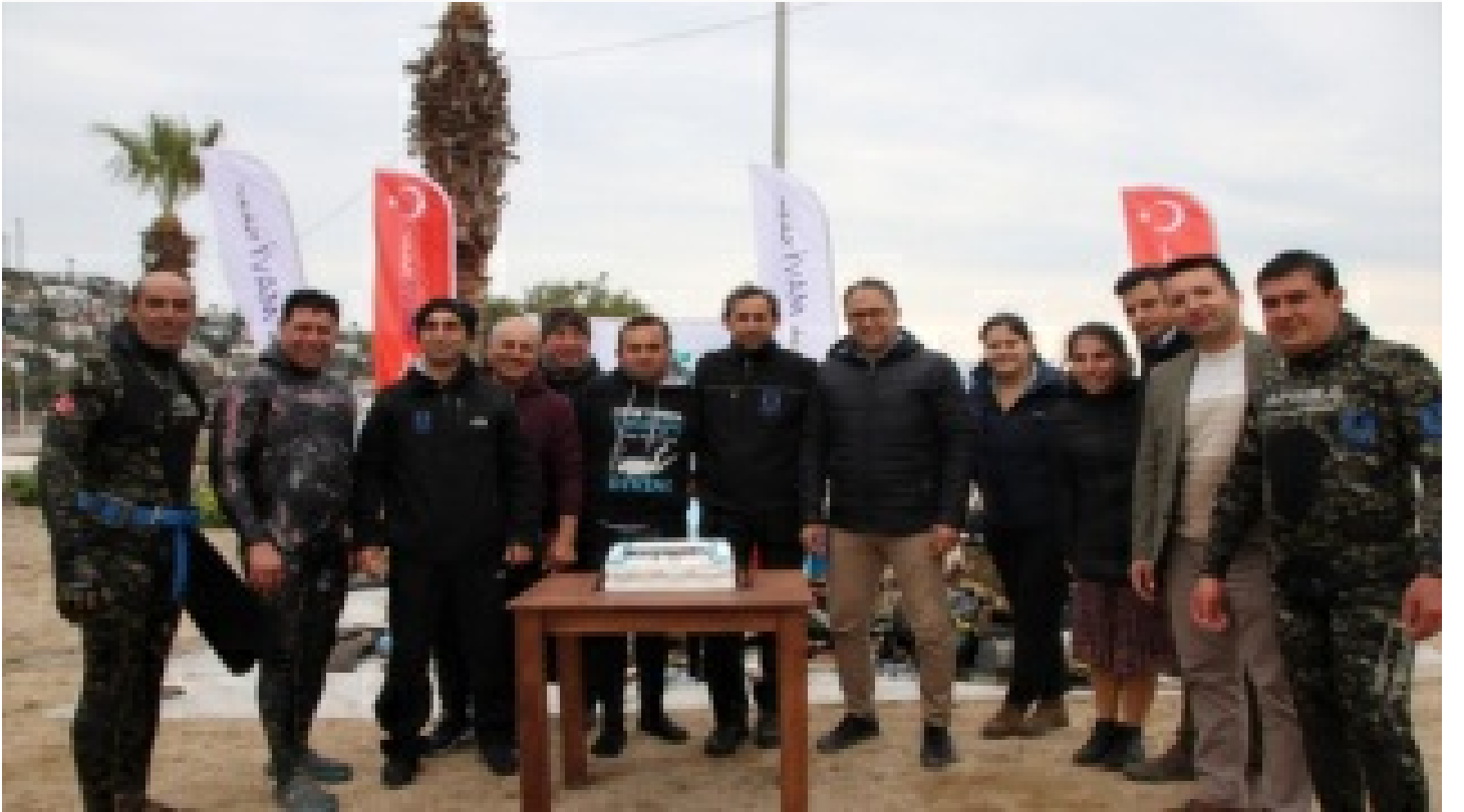
Dalgıçlar denizi, öğrenciler kıyayı temizledi