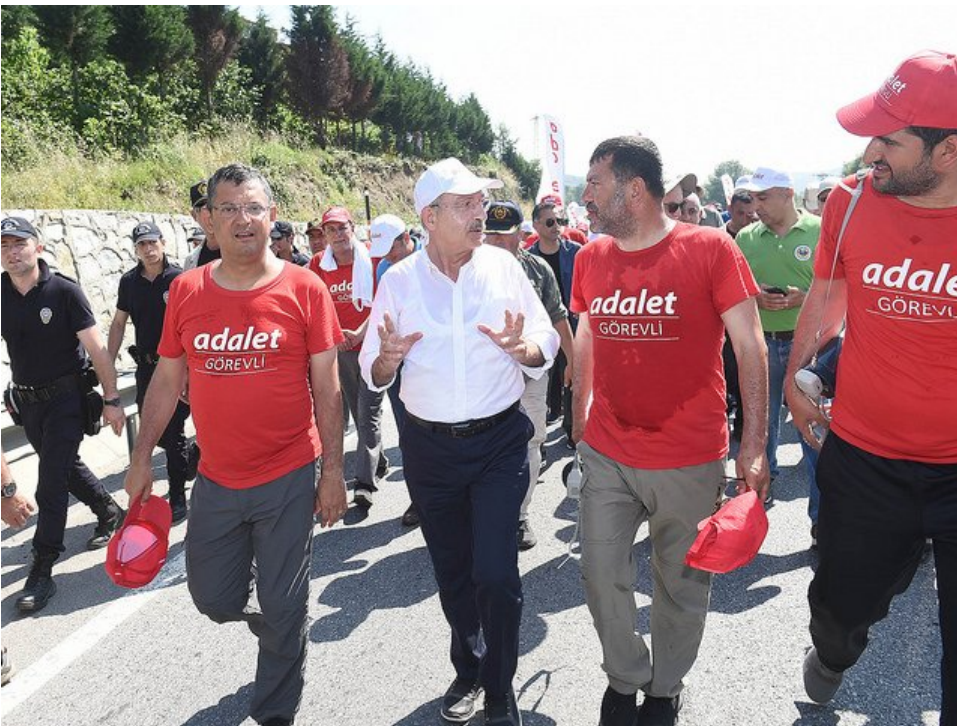
TOPUKLARI İLTİHAPLANDI YÜRÜMEKTEN VAZGEÇMEDİ