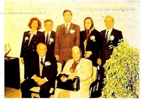
Tarih: 1992. Yer: Bursa Doğuşlu Doğum ve Doğum Projesi Ofis Açılışı ve Temel Atma Töreni. Gözetim: Saldırı, Akın, Karadayı, eniştesi Yılmaz Karadayı, Hamdi Akın, ablası Meriç Köken, eniştesi Sabri Köken (Öğütüran). Babası Hasan Bey ve annesi Hilmet hanım.

Peki sizce Aziz Yıldırım'ın bırakılması zamanı mıdır? Bana kalırsa kendisinin bırakılması lazım. Yeter artık. Tepeleyen bırakılmak istiyor. Bak Başkan Erdoğan bile üçüncü dönemde bırakıyor.