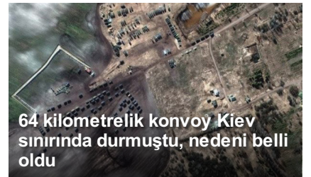
64 kilometrelik konvoy Kiev sınırında durmuştu, nedeni belli oldu