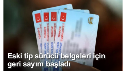
Eski tip sürücü belgeleri için geri sayım başladı