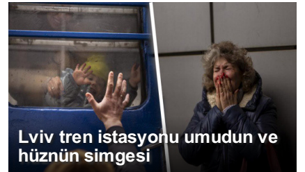
Lviv tren istasyonu umudun ve hüznün simgesi

Etiketler : darbe,fetö,kuleli askeri lisesi, 15 temmuz,