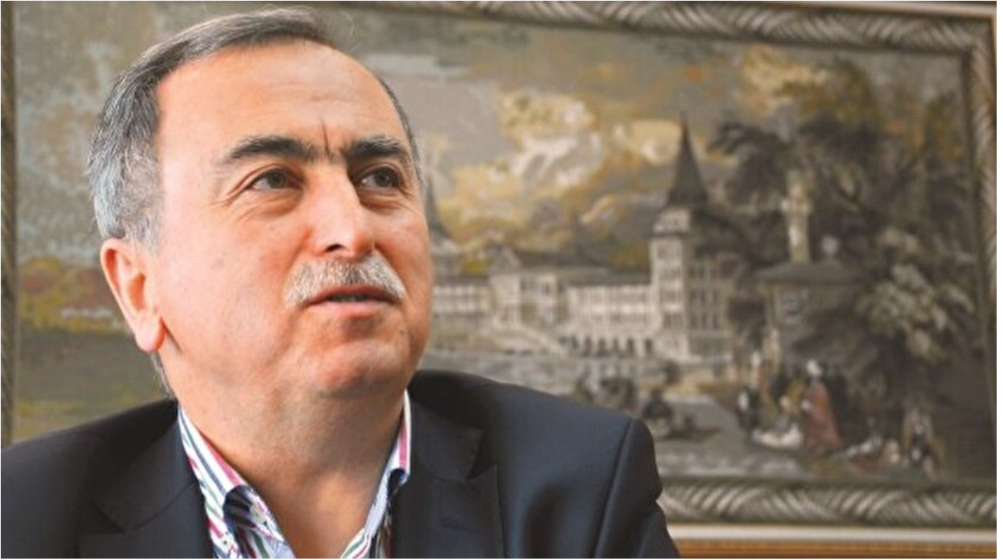
Meclis FETÖ Darbe Girişimini Araştırma Komisyonu Başkanı Reşat Petek