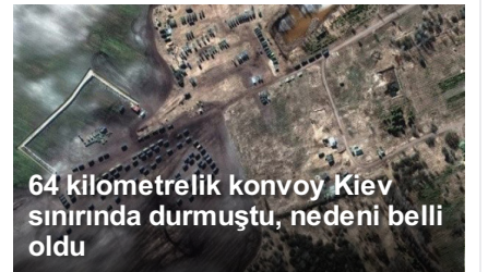
64 kilometrelik konvoy Kiev sınırında durmuştu, nedeni belli oldu