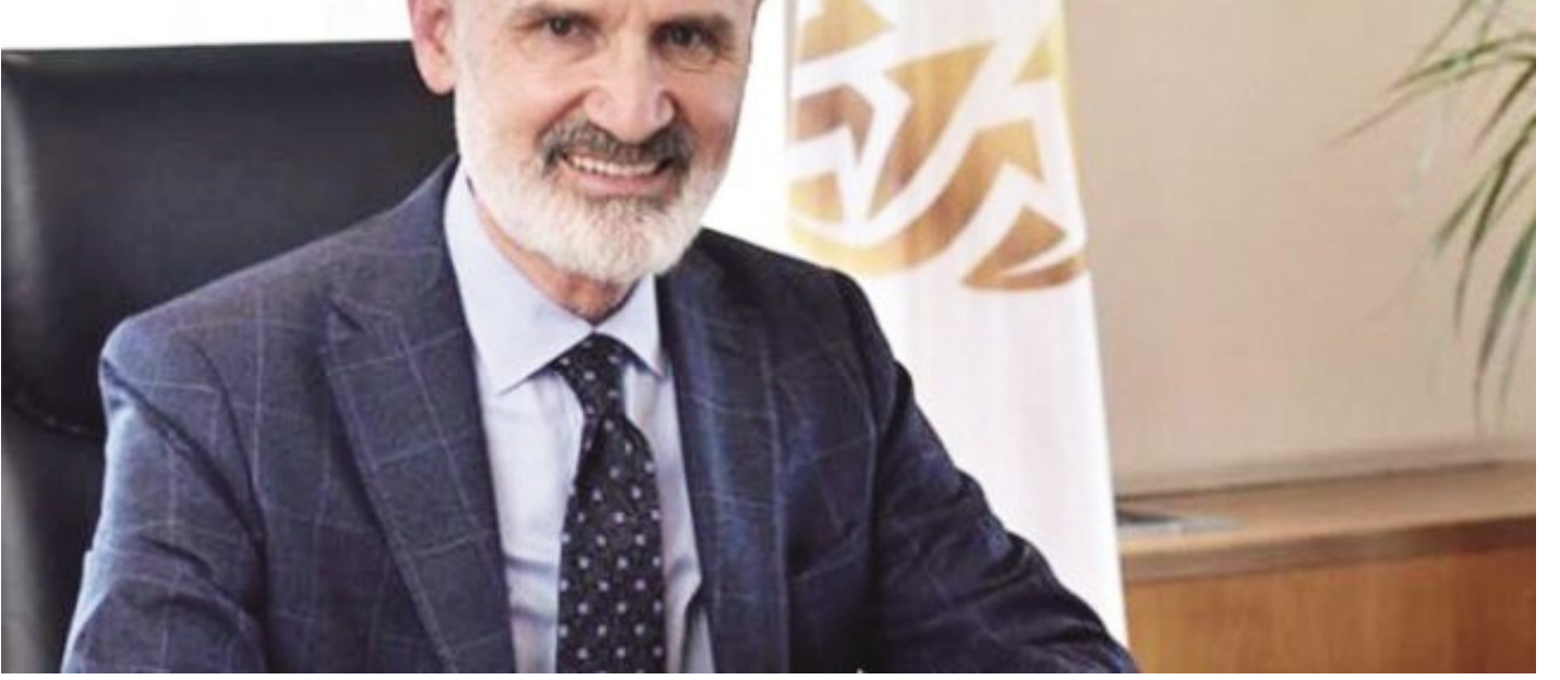
İstanbul Ticaret Odası (İTO) Başkanı Şekib Avdagiç