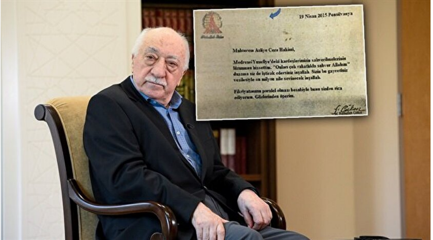
FETÖ elebaşı Fetullah Gülen

Haber Merkezi · 15 Aralık 2017, 11:53 · Son Güncelleme: 15 Aralık 2017, 15:30 · IHA, AA