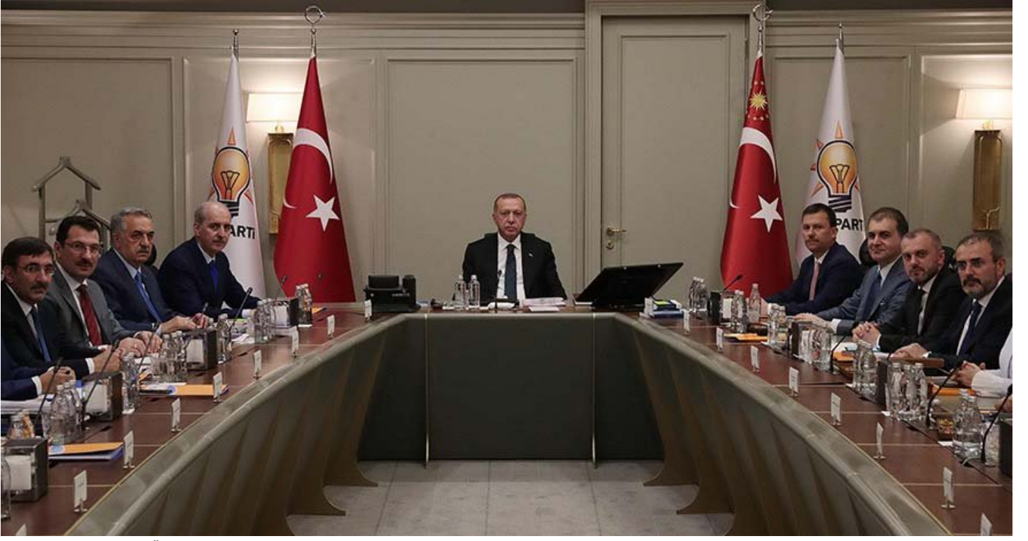
Erdoğan, 2018'de "FETÖ'nün bizim zamanımızda büyüdüğünü reddetmem" demişti.