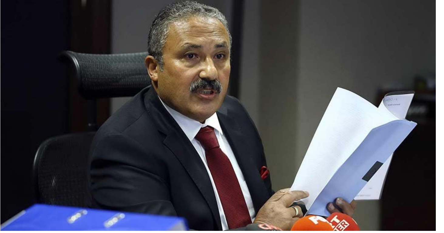
HSK Başkanvekili Mehmet Yılmaz