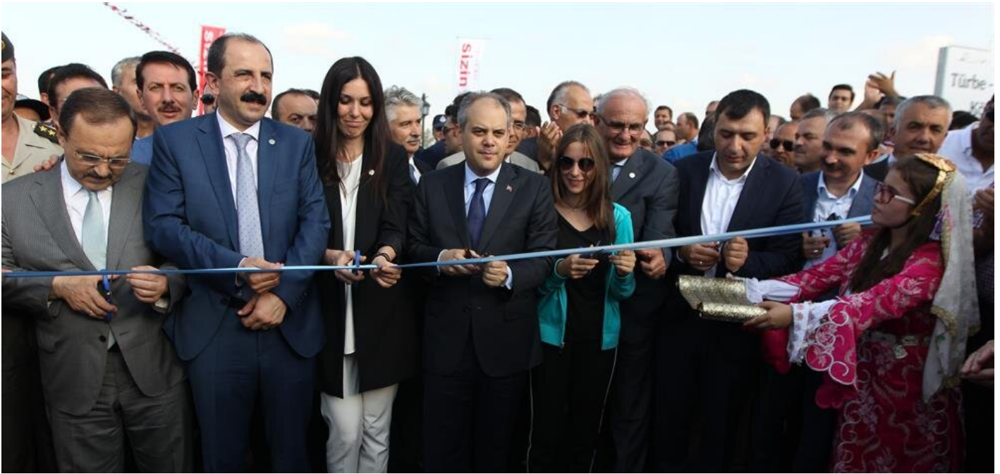
Türbe-Kalaylı Köprüsü'nün açılışı, Gençlik ve Spor Bakanı Akif Çağatay Kılıç'ın katılımıyla gerçekleşti.

Köprünün yapımında emeği geçenlere teşekkür eden Çiğdem Karaaslan ise, "Bu güzel yatırıma aslında Baframız için değil Alaçam, Yakakent, 19 Mayıs gibi bu bölge için çok önem arz eden bu yatırıma katkı veren herkesi canı gönülden tebrik ediyorum" diye konuştu.