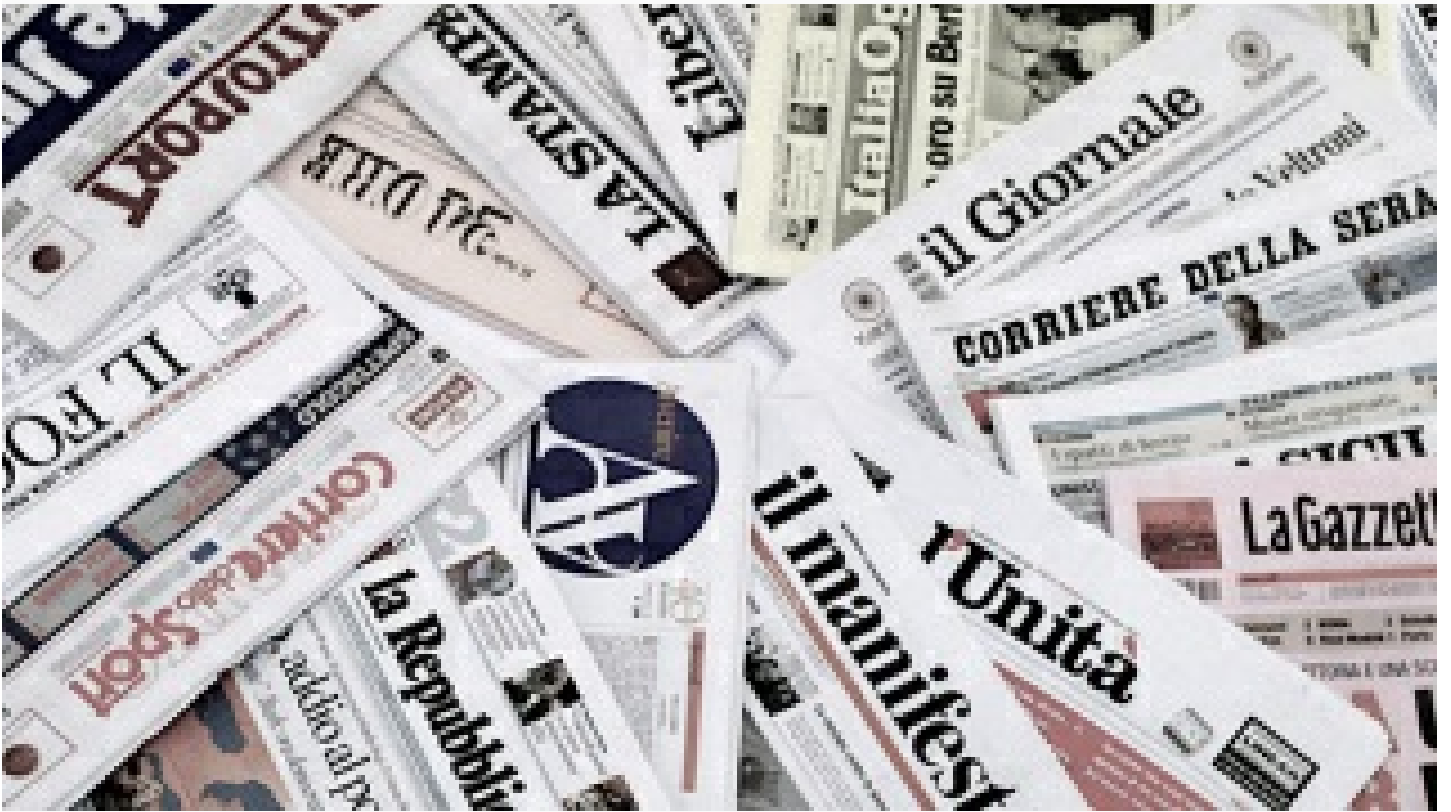
Rusya'dan Batı'nın medya ambargosuna cevap