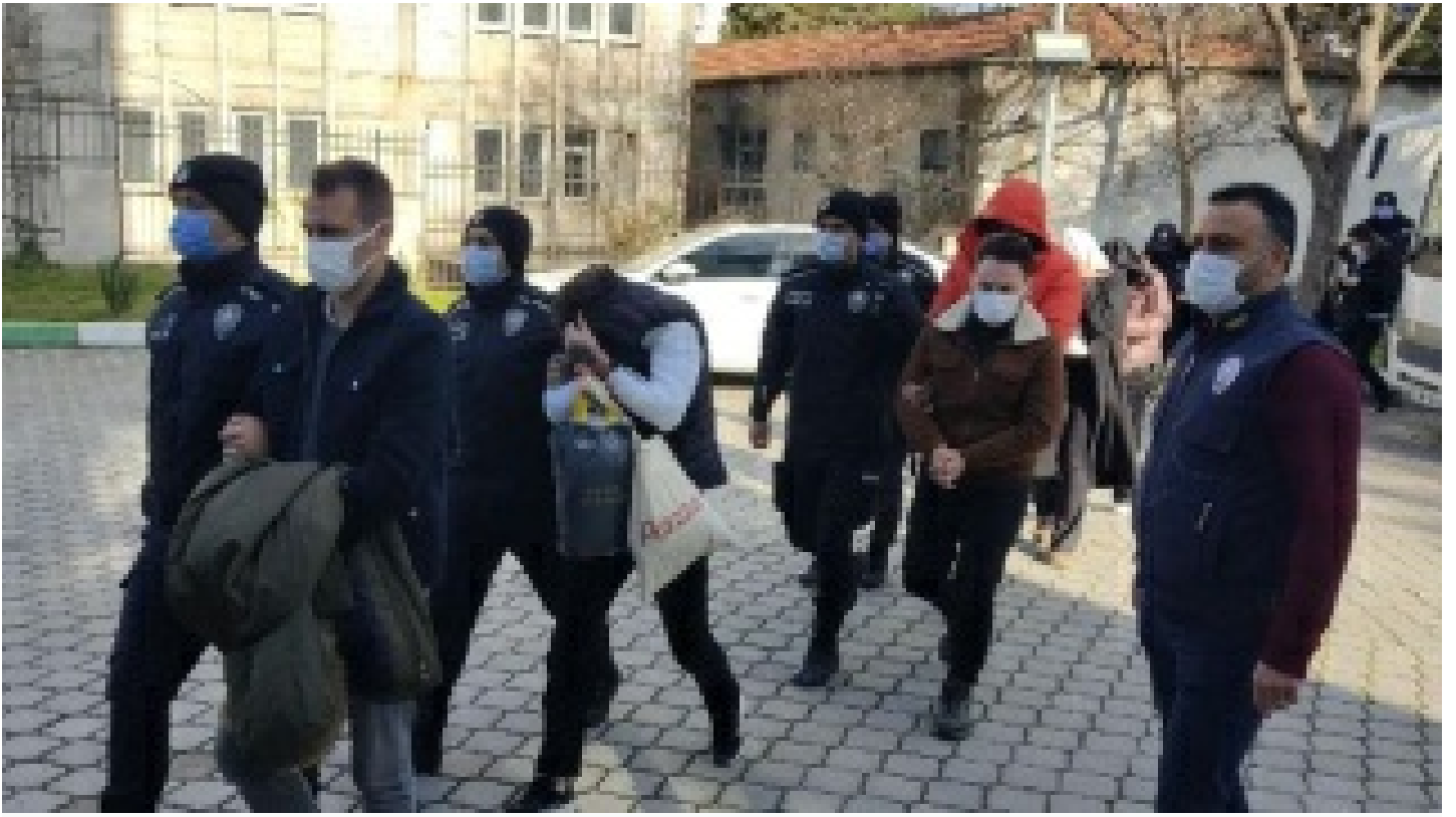
5 ilde yasa dışı bahis operasyonu: 20 gözaltı