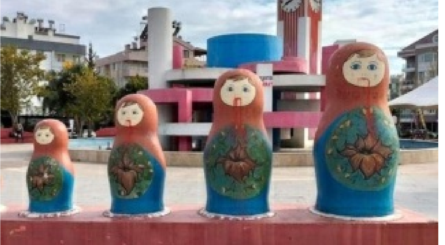
Antalya'da matruşkalara boyalı saldırı