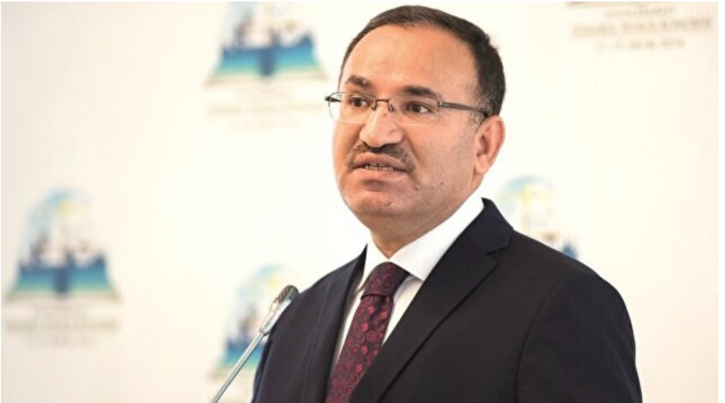
Adalet Bakanı Bekir Bozdağ