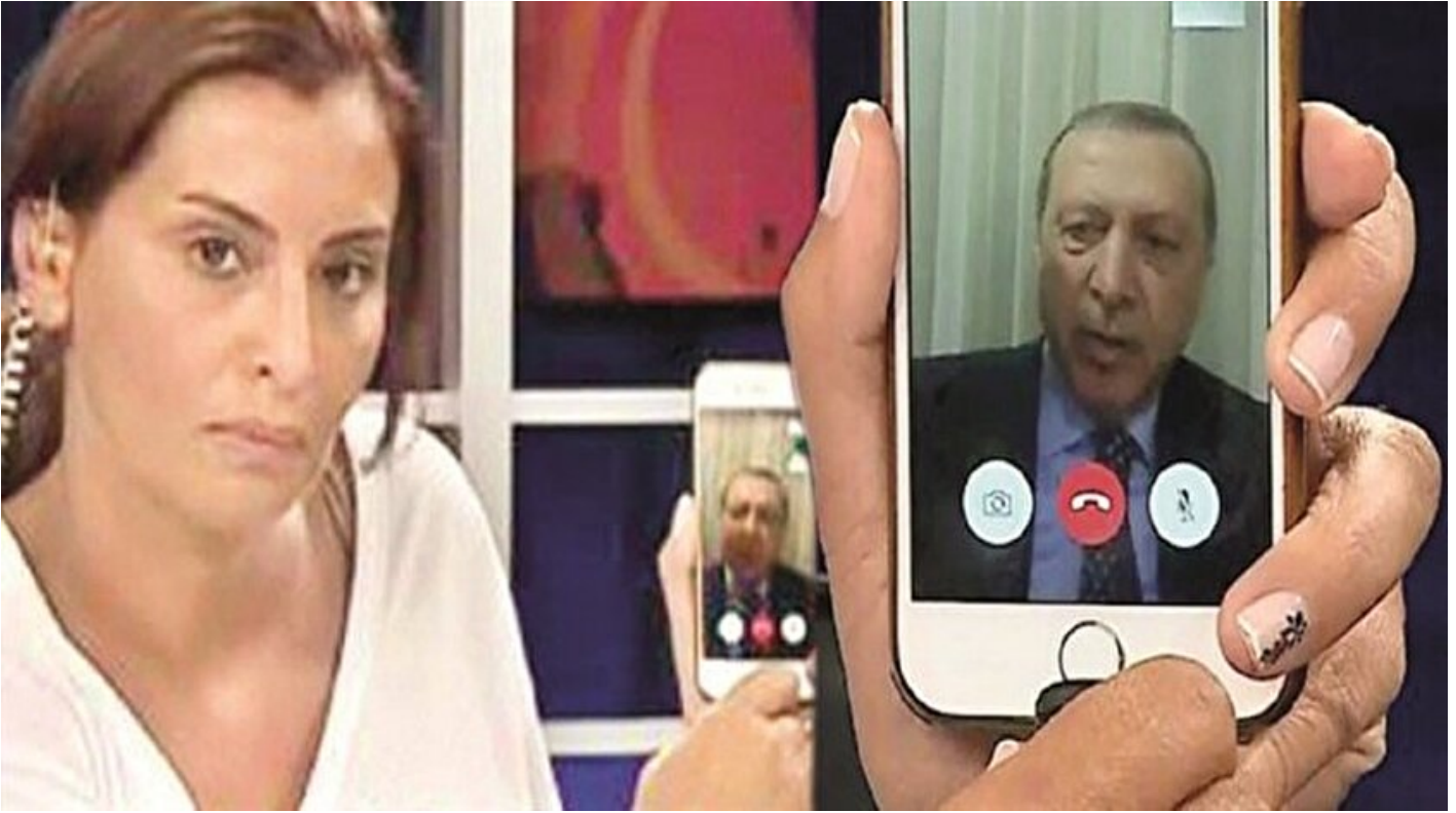
Darbeye karşı direnen medya