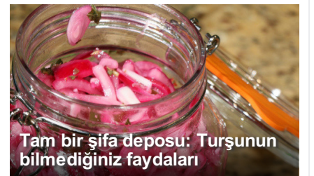
Tam bir Őifa deposu: TurŐunun bilmediđiniz faydaları