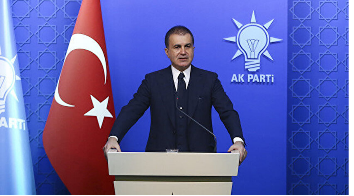
AK Parti Sözcüsü Ömer Çelik

Haber Merkezi · 18 Temmuz 2019, 22:09 · Son Güncelleme: 18 Temmuz 2019, 22:11 · AA