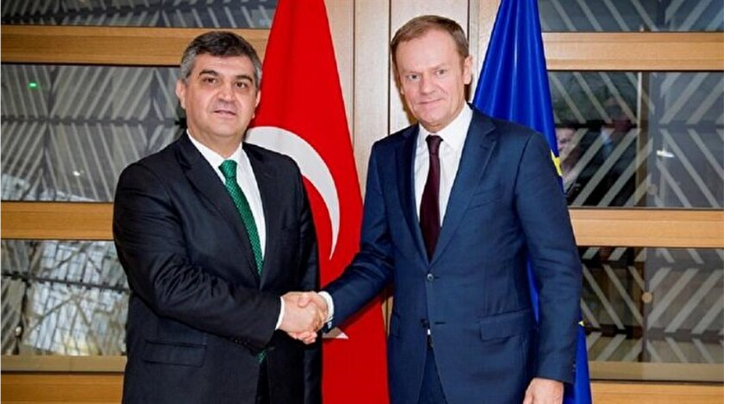
Faruk Kaymakçı, Donald Tusk

Haber Merkezi · 08 Şubat 2017, 18:50 · Son Güncelleme: 08 Şubat 2017, 18:51 · AA