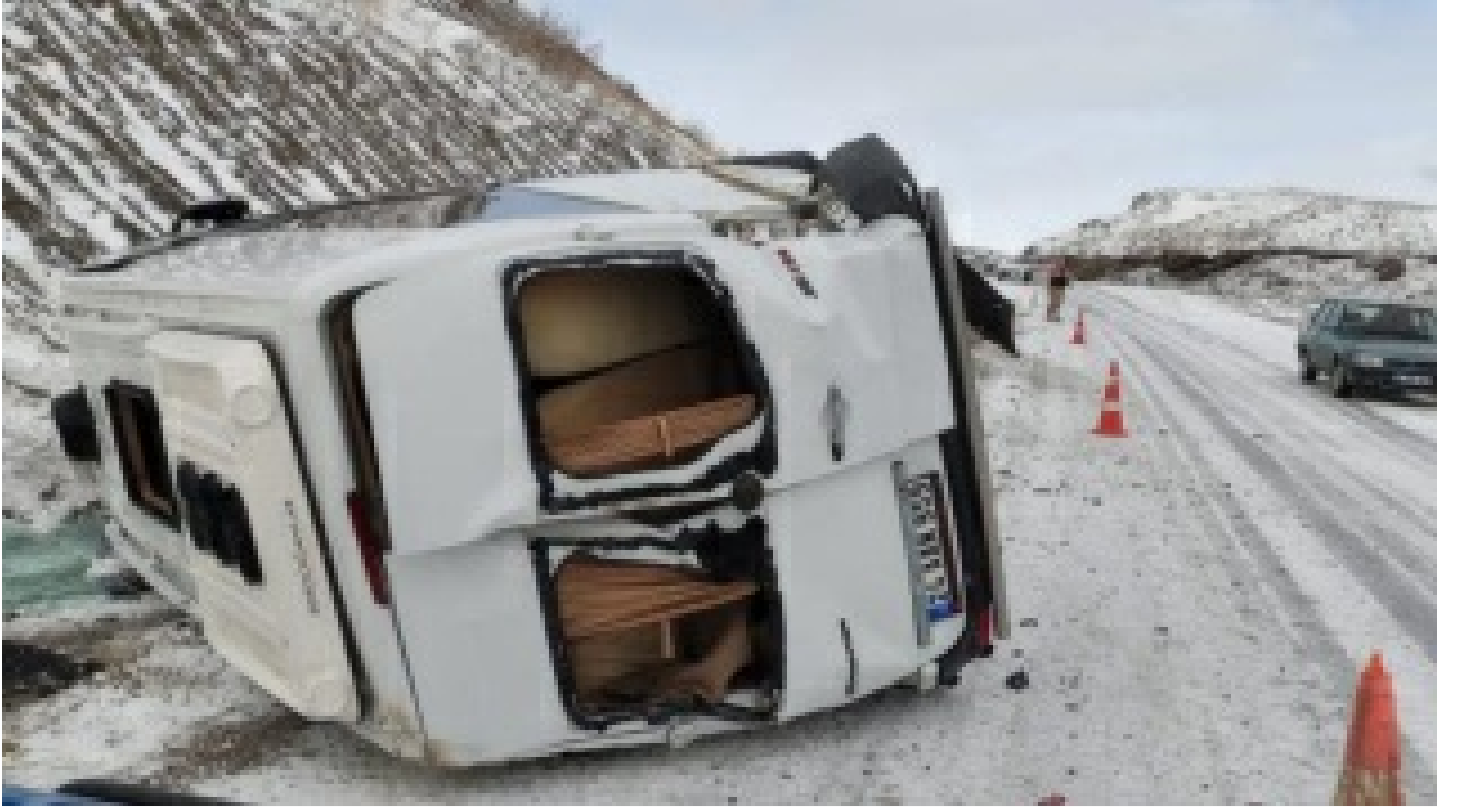
Erzincan'da devrilen minibüsteki 8 kişi yaralandı