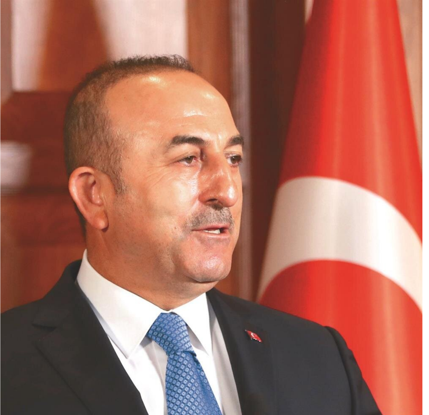
Dışişleri Bakanı Mevlüt Çavuşoğlu

ABD'nin açık tehdidine rağmen Türkiye'nin sınır güvenliğini korumak için planlarını değiştirmeye niyeti yok. Sınırdaki DEAŞ ve PKK kaynaklı terörist faaliyetler binlerce silah, militan ve canlı bombanın ülke içine sızmasına zemin hazırlamıştı. Fırat Kalkanı Harekâtı ile birlikte ülke içinde de yapılan askeri operasyonlarla bu faaliyetlerin büyük oranda beli kırıldı. Türkiye sınır güvenliğini sağlamak için son ana kadar askeri faaliyetlerine devam edecek. Kaynaklar PKK'ya yönelik planlanan operasyonların geniş bir coğrafyada cereyan edeceğini, buna Münbiç, Tel Abyad, Ayn el-Arab, Haseke, Karaçok ve Sincar'ın da dahil olduğunu, Türkiye'ye engel olmak istendiği takdirde ABD askerlerinin bundan 'zararlı' çıkacağını kaydediyor.