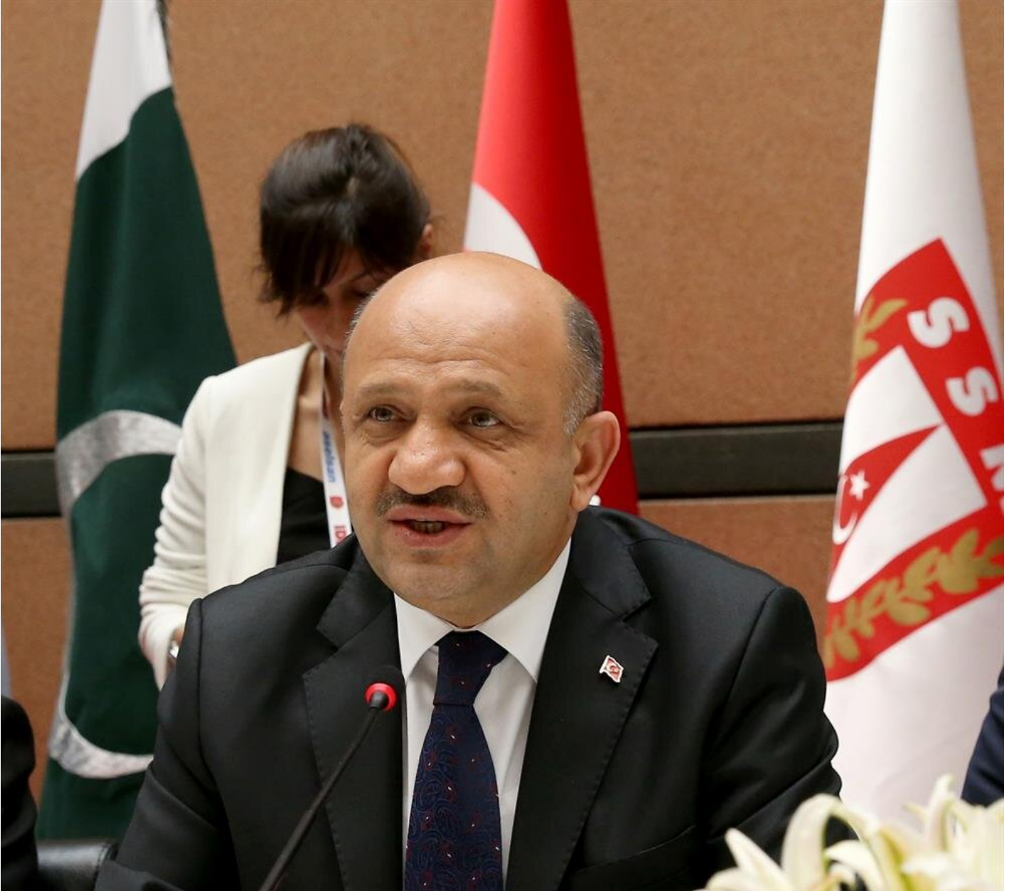
Milli Savunma Bakanı Fikri Işık

Dışişleri Bakanı Mevlüt Çavuşođlu, Suriye PKK'sının Donald Trump imzasıyla doğrudan teçhiz edilecek olmasına tepki gösterdi. Karadađ'ın başkenti Podgorica'da basın mensuplarına konuşan Çavuşođlu, "YPG ve PKK ikisi de terör örgütüdür, hiçbir farkı yoktur. Sadece adı farklıdır ve bunların eline geçen her silah, Türkiye'ye yönelik bir tehdittir. Daha önce YPG'ye verilen silahların Türkiye'de PKK'nın elinde yakalandığını sizlerle de paylaşmıştık" dedi. PKK yönetimindeki 'Suriye Demokratik Güçleri'nden terörist unsurların ayrıştırılmasını ve Rakka'ya Arap güçlerin girmesi gerektiğini kaydeden Çavuşođlu, "Operasyonun başarısı için de bu çok önemlidir. Çünkü Rakka, yüzde 99 Sünni Arap şehirdir. Dolayısıyla Suriye içindeki şehirlerin geleceğini de iyi planlamamız lazım. Yani DAESH sonrası da planlamamız lazım. Eğer Suriye'nin sınır bütünlüğünü, toprak bütünlüğünü destekliyorsak ve Suriye'nin istikrarını önemsiyorsak, özellikle Irak'ta yaptığımız hatalardan da ders alarak burada yanlış adımlar atmamız lazım" diye konuştu.