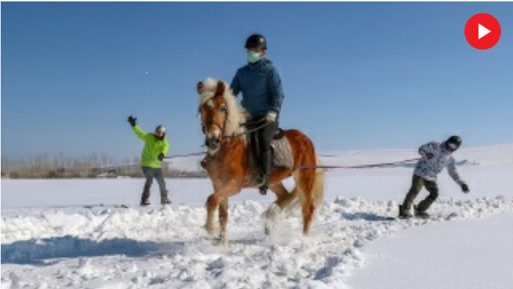
Van'da sporcular karda 'atlı snowboard' yaptı