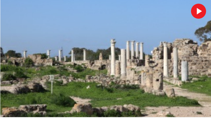
KKTC'de binlerce yıllık geçmişe sahip antik kent: Salamis Harabeleri