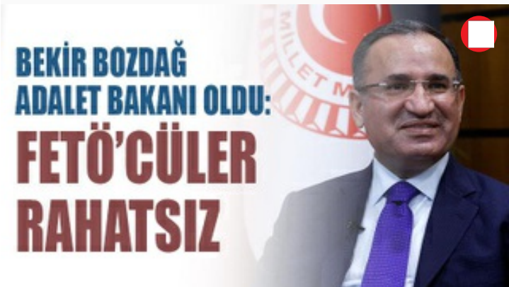
Bekir Bozdağ Adalet Bakanı oldu: FETÖ'cüler rahatsız