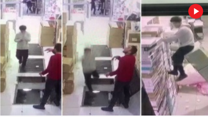
Telefonuna bakarken alt kata düştü!