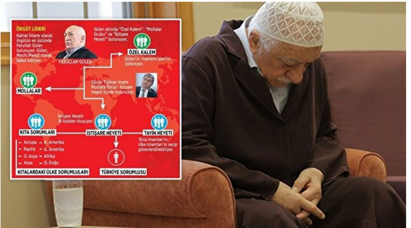
FETÖ elebaşı Fetullah Gülen

Haber Merkezi · 22 Aralık 2016, 10:08 · Son Güncelleme: 22 Aralık 2016, 10:23 · Diğer