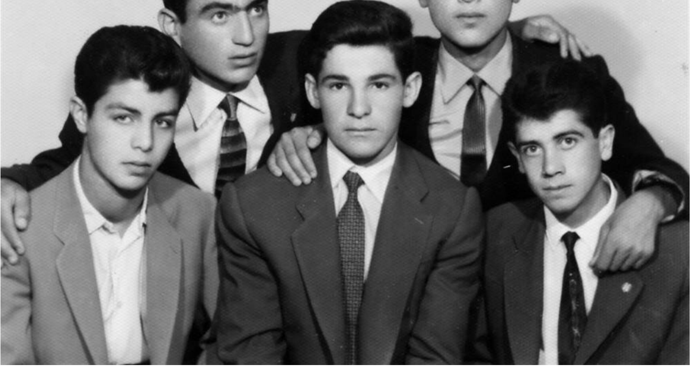
Siirt lisesinde arkadaşlarıyla birlikte.