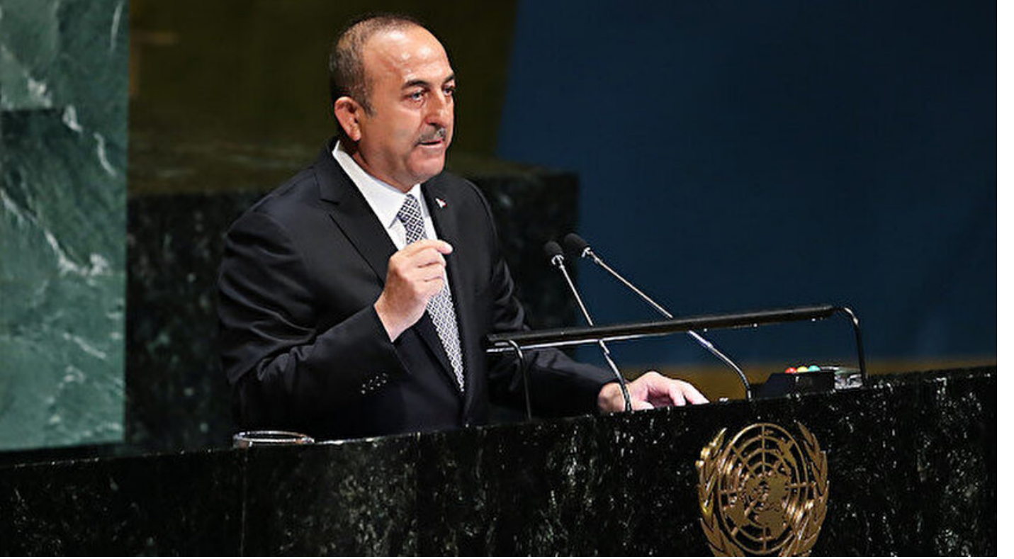
Dışişleri Bakanı Mevlüt Çavuşoğlu

Haber Merkezi · 02 Nisan 2019, 17:25 · Son Güncelleme: 02 Nisan 2019, 20:36 · Diğer