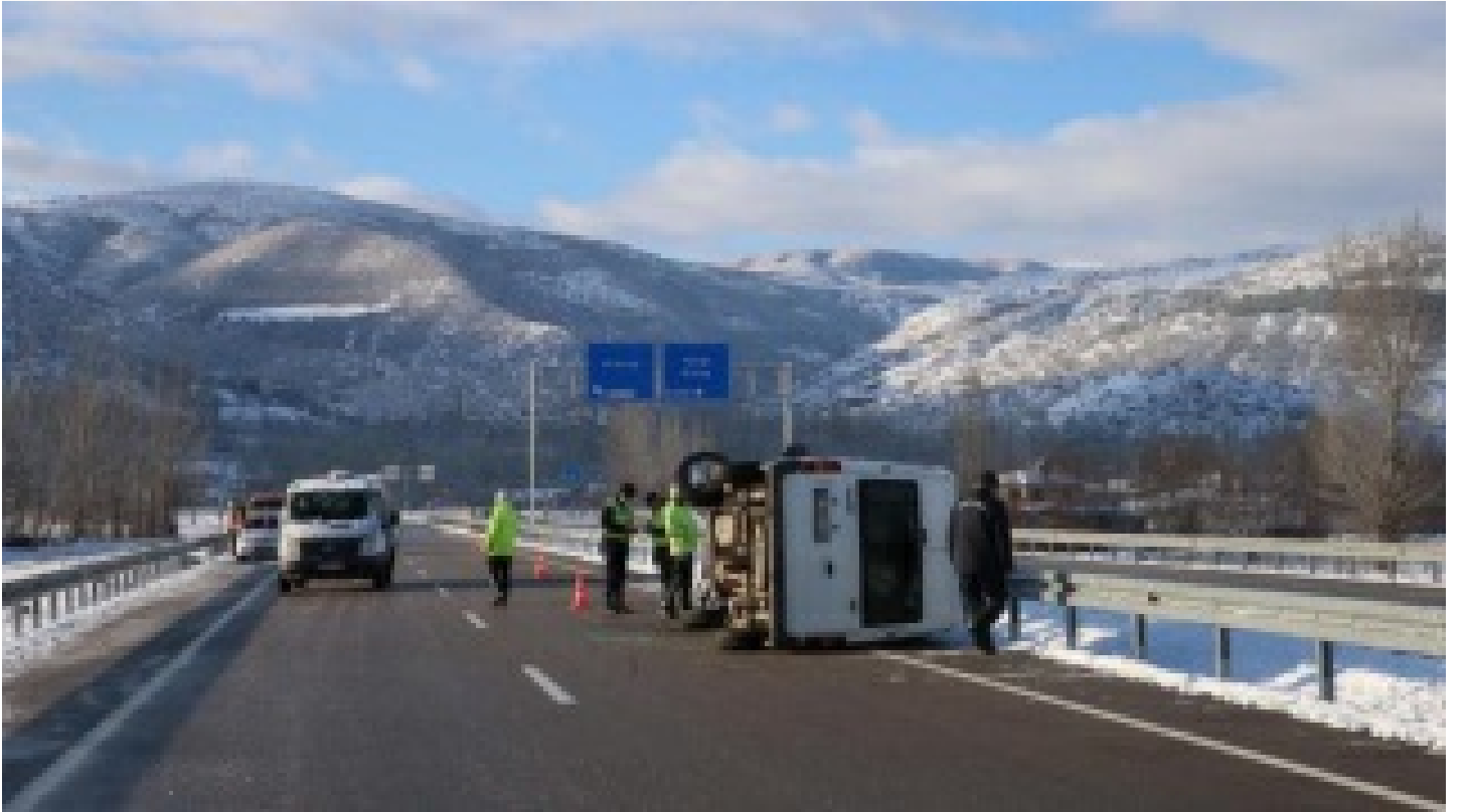
Askerleri taşıyan servis devrildi: 1 şehit, 3 yaralı