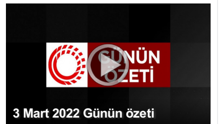
3 Mart 2022 Günün özeti