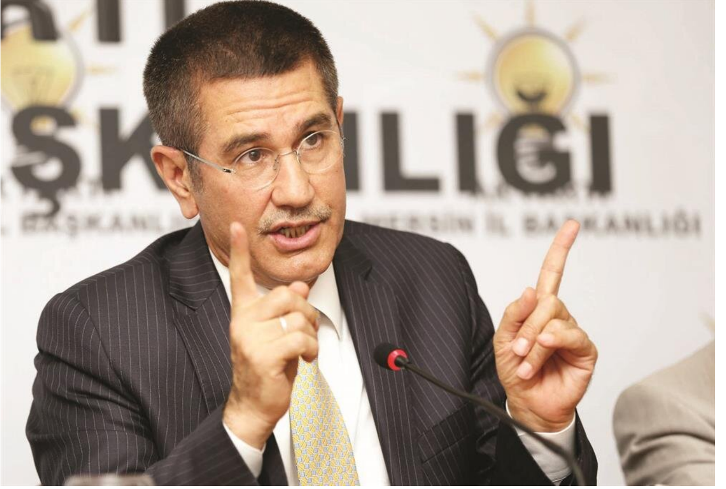
Milli Savunma Bakanı Nurettin Canikli

hedeflediğini anlatan Milli Savunma Bakanı Nurettin Canikli, FETÖ'nün izlediği hain plan hakkında şu bilgileri verdi: "Bin 800'ün üzerinde itirafçı var. Böyle bir rakamda örgütün tamamen çökmesi, tasfiye olması gerekiyor. Ama bakıyoruz hala kriptolar var."