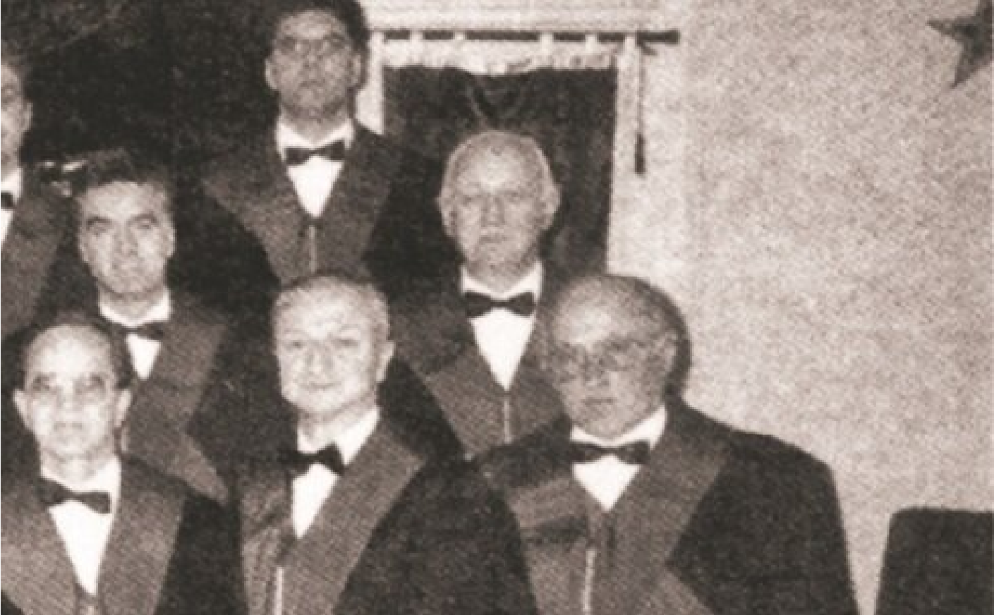
Hamdi Nüzhet Çançar