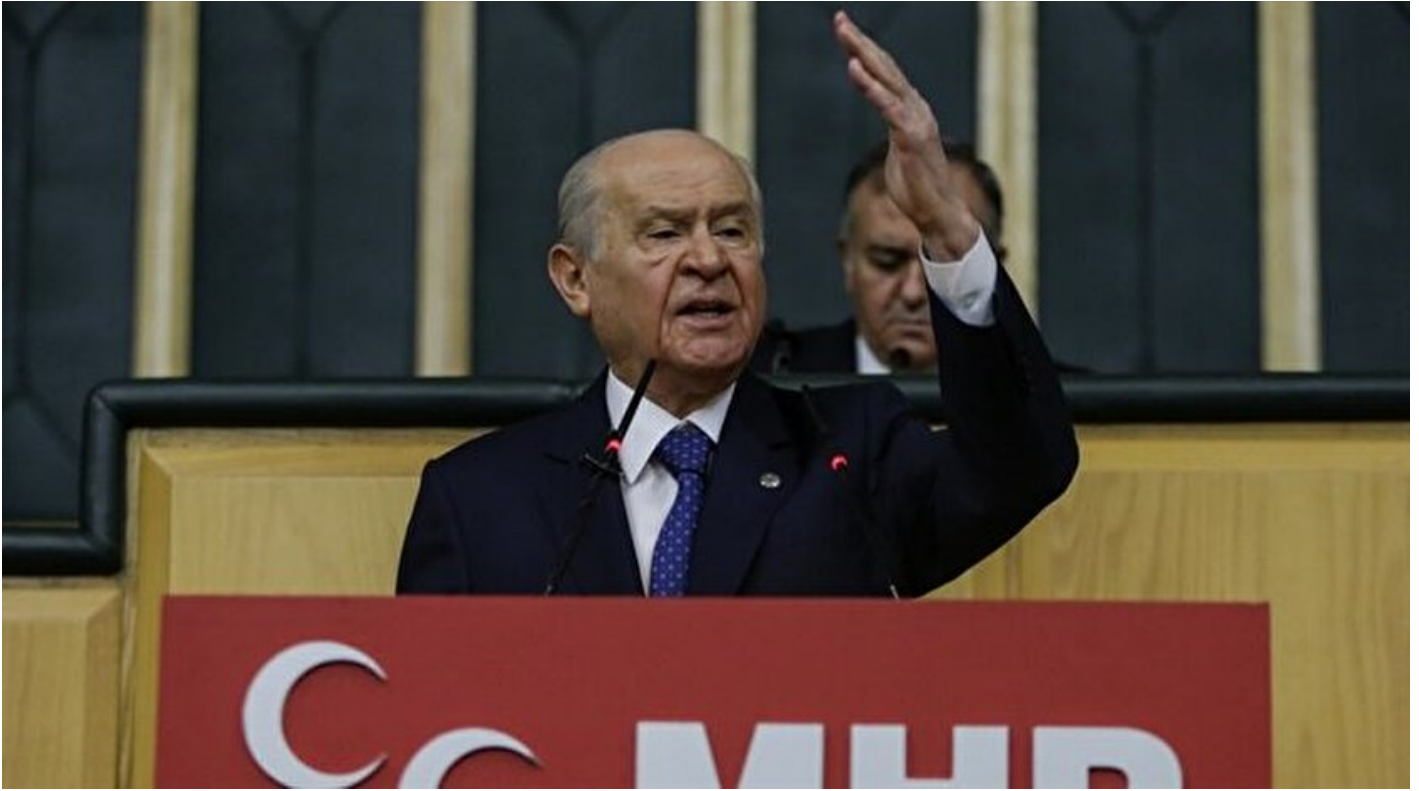
MHP Genel Başkanı Devlet Bahçeli