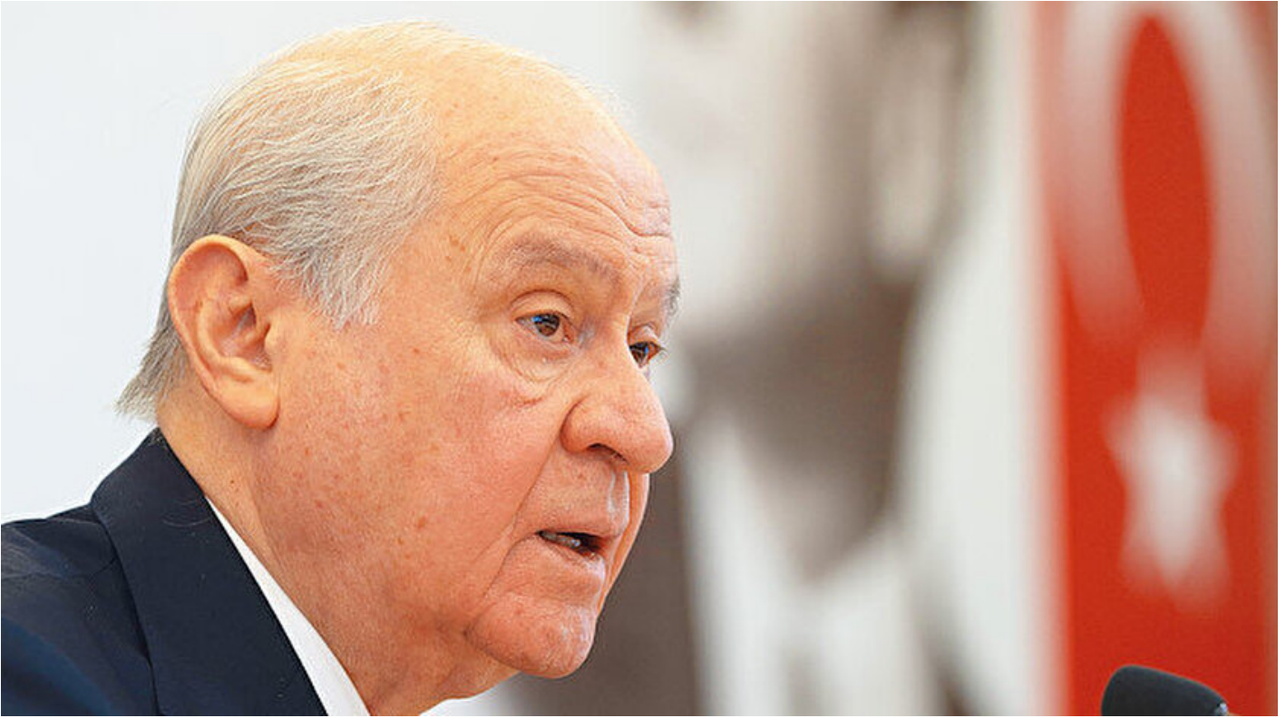
MHP Genel Başkanı Devlet Bahçeli