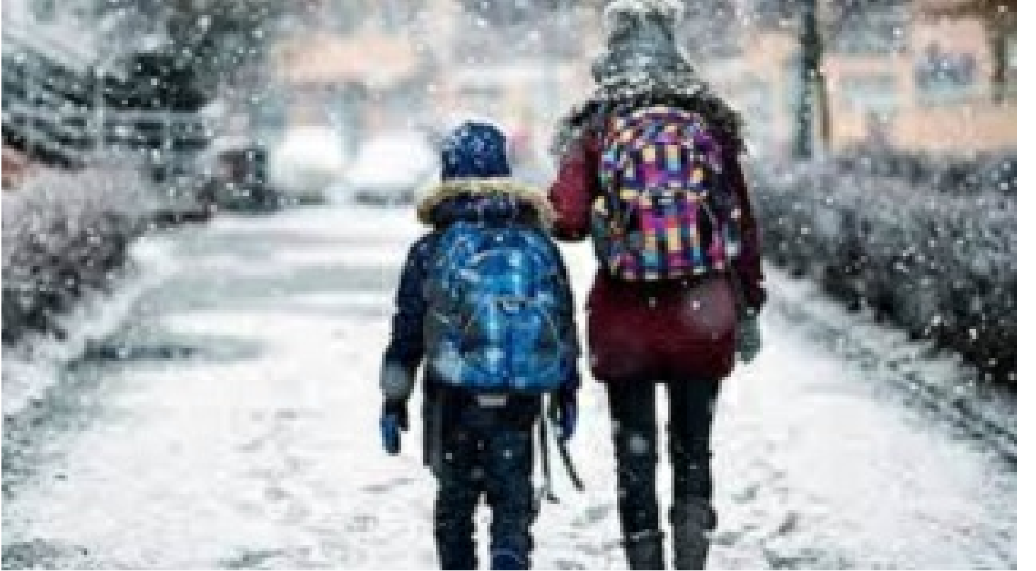
8 ilde eğitime kar engeli