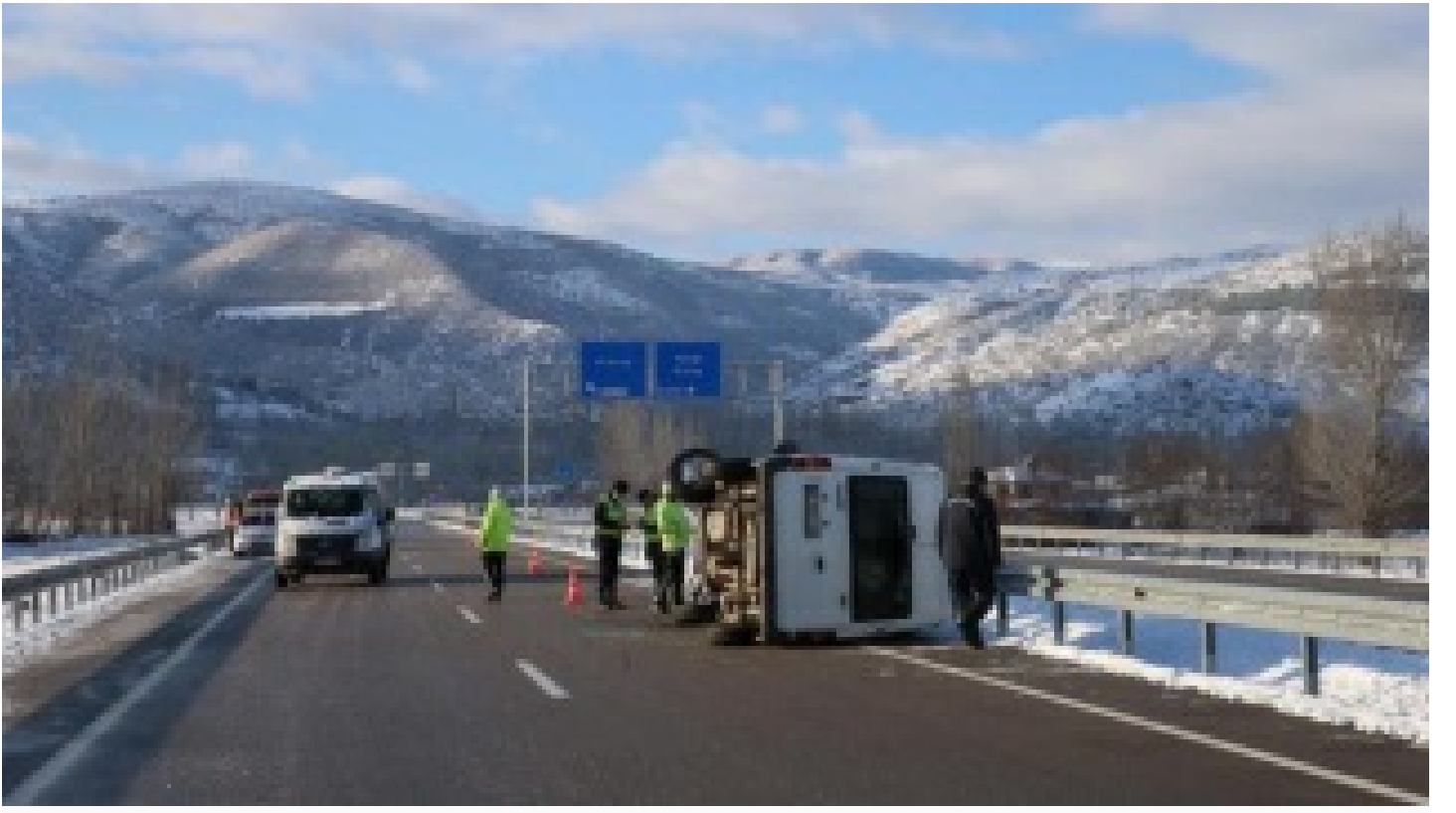
Askerleri taşıyan servis devrildi: 1 şehit, 3 yaralı