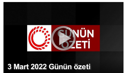
3 Mart 2022 Günün özeti