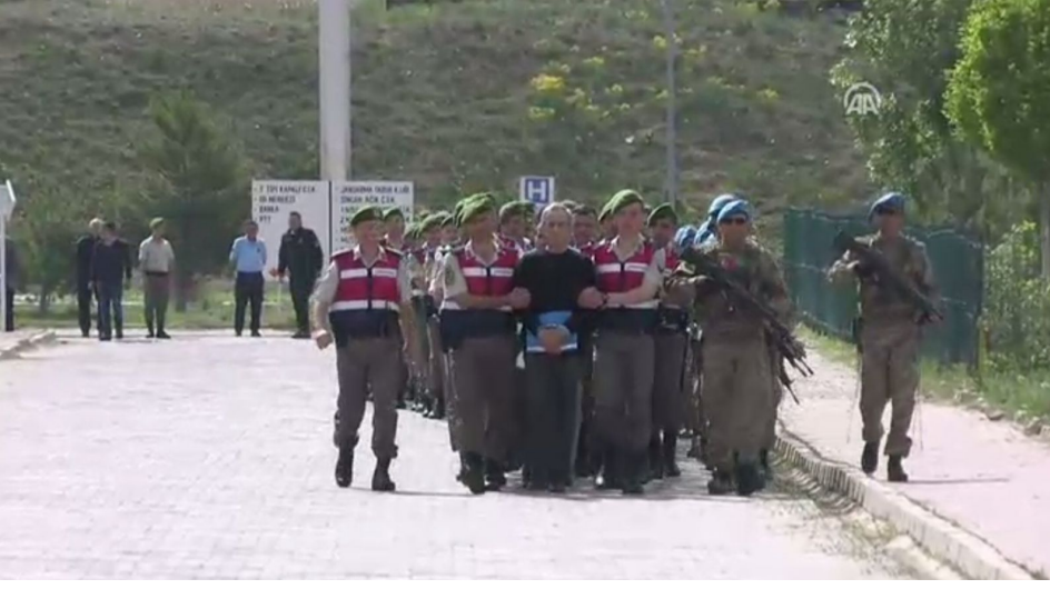
FOTOĞRAF: Darbeciler halkın önünden geçirilerek mahkeme salonuna götürüldü.