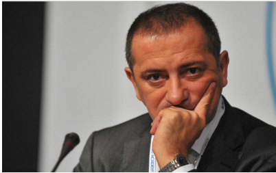
Fatih Altaylı'dan yeni kabine için olay sözler!

GEREKİRSE DEMİRYOLU İNŞA EDİLEBİLİR: Dağlık Karabağ meselesini hiç bırakmadık hep üzerine gittik. Malum Nahçıvan ile karayolu arasında sıkıntılar aşılmış durumda. Gerekirse demiryolu inşa edilebilir.