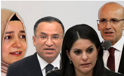
23 kişi dışarıda kaldı! İşte yeni kabinede yer almayan isimler