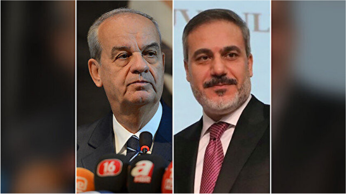
İlker Başbuğu ve Hakan Fidan.