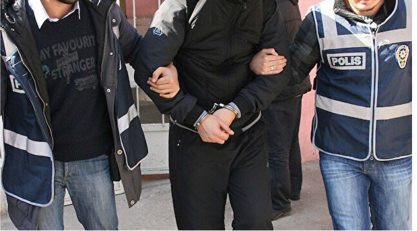
Ankara'da FETÖ operasyonu

Haber Merkezi · 14 Aralık 2018, 10:22 · Son Güncelleme: 14 Aralık 2018, 10:44 · AA