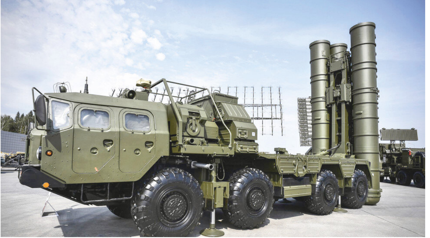
S-400 füze rampasının önümüzdeki günlerde getirilmesi bekleniyor.

S-400 sistemlerinin ilk grup intikalleri yaklaşık 2 hafta sürecek. Sevkiyatın tamamlanması ardından ikinci grupta fırlatma rampaları ve silah sistemlerinin diğer unsurları Mürted'e yine hava yoluyla getirilecek. Üçüncü grupta ise sistemin ana mühimmatları olan füzeler Türkiye'ye ulaşacak. Önümüzdeki günlerde 120'yi aşkın uzun menzilli füzenin deniz yoluyla getirilmesi bekleniyor.