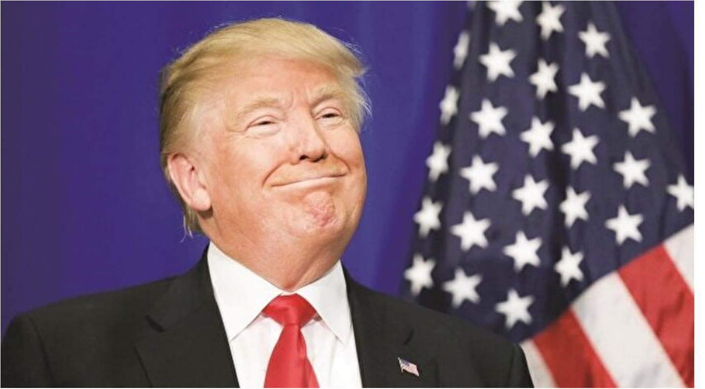
ABD Başkanı Trump

Haber Merkezi · 19 Nisan 2018, 04:00 · Yeni Şafak