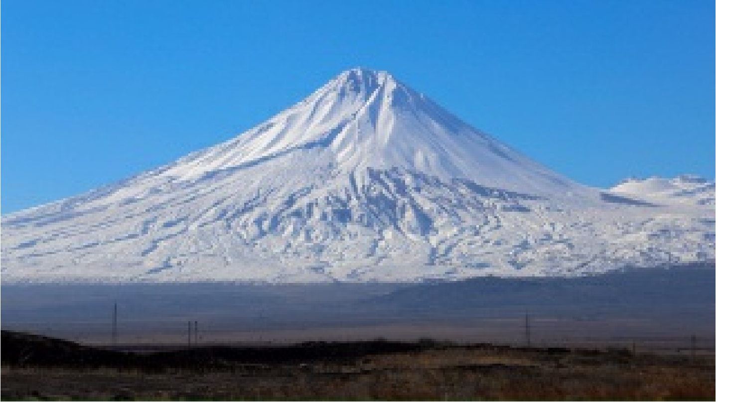
Ağrı Dağı Kış Tırmanışı, 6 Mart Pazar günü başlayacak