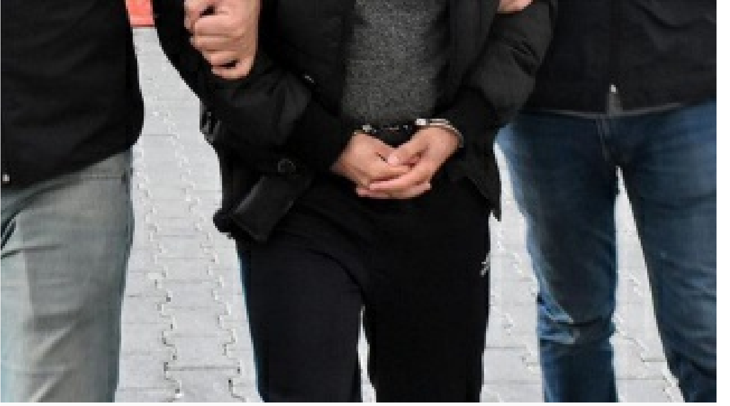
Afyonkarahisar'da 11 yıl 3 ay hapis cezasıyla aranan hükümlü yakalandı