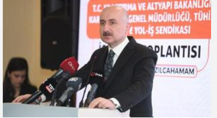
Bakan Karaismailoęlu: 1915 Çanakkale Köprüs¼, yeni Türkiye'nin bir mesajıdır