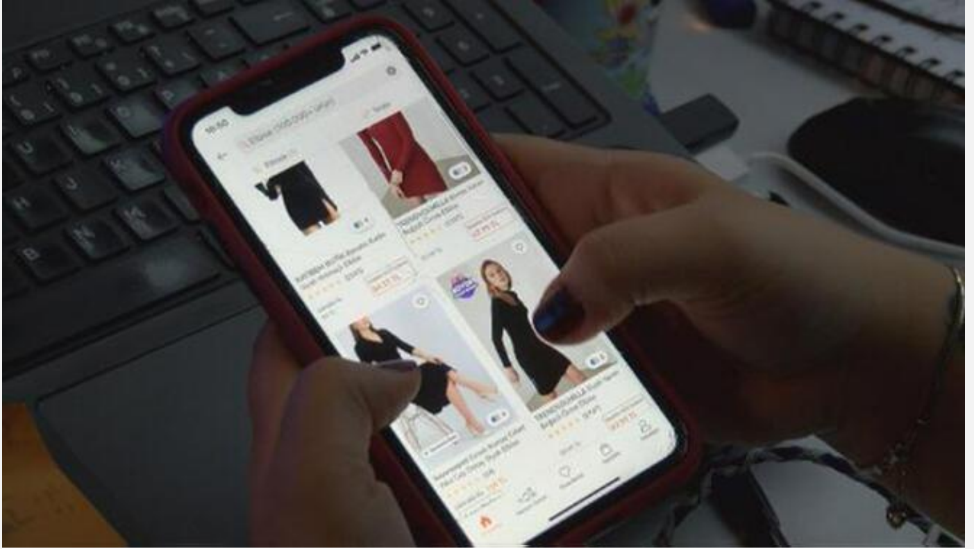
Ticaret Bakanlığı'ndan '14 Şubat' uyarısı