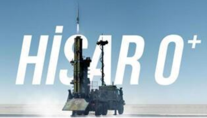
HİSAR hava savunma sistemine yeni kabiliyet