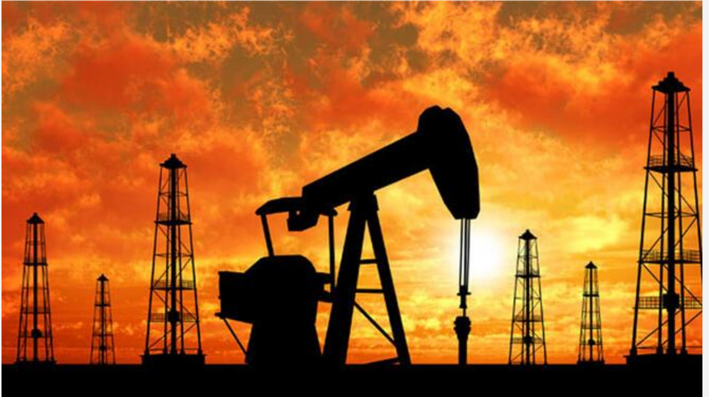
Japonya acil durum rezervlerini açıyor