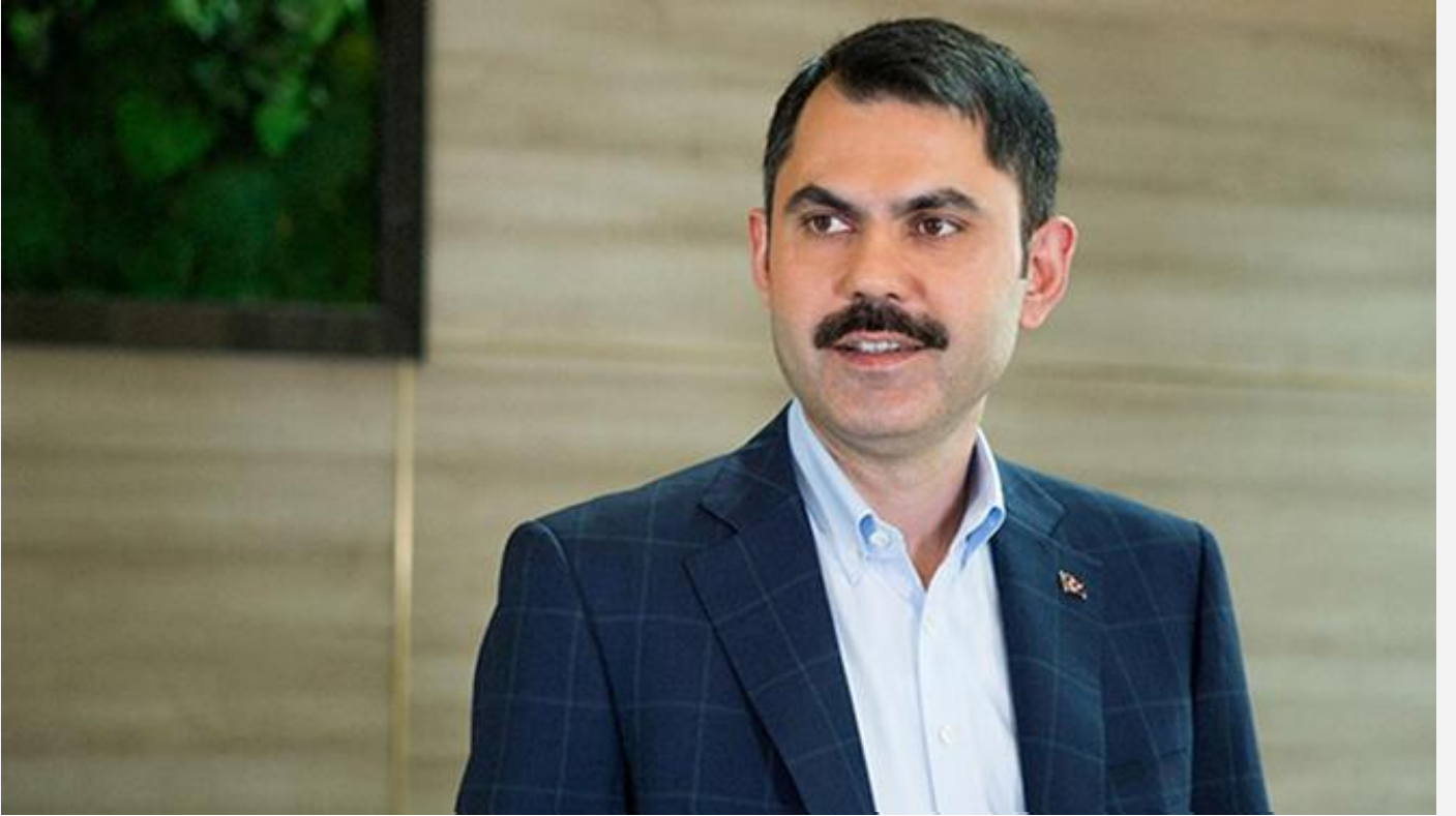
Bakan Kurum'dan Deprem Haftası mesajı