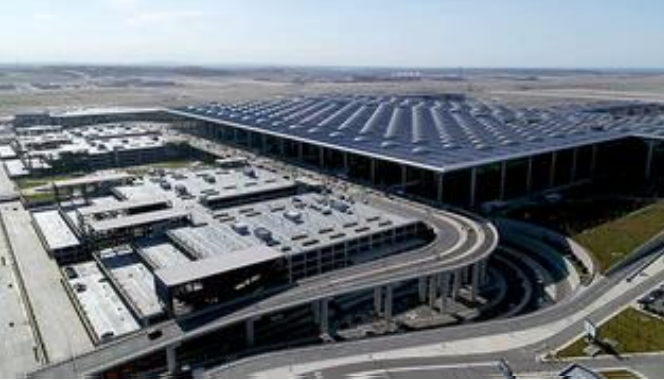
İstanbul Havalimanı 'Yılın Havalimanı' öd¼l¼ne ikinci kez layık gör¼ld¼