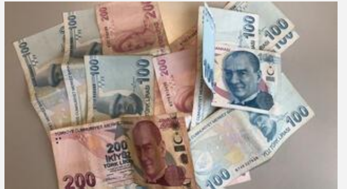
Bakan açıkladı! Ödemeler başlıyor