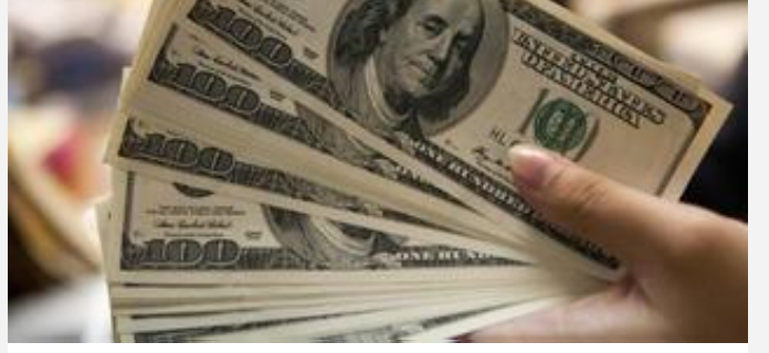
Merkez Bankası'nın toplam rezervleri arttı