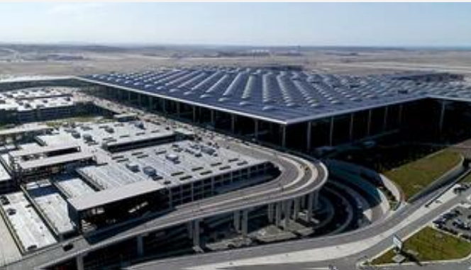
İstanbul Havalimanı ge¼en hafta Avrupa'da en çok uçuř yapılan havalimanı oldu