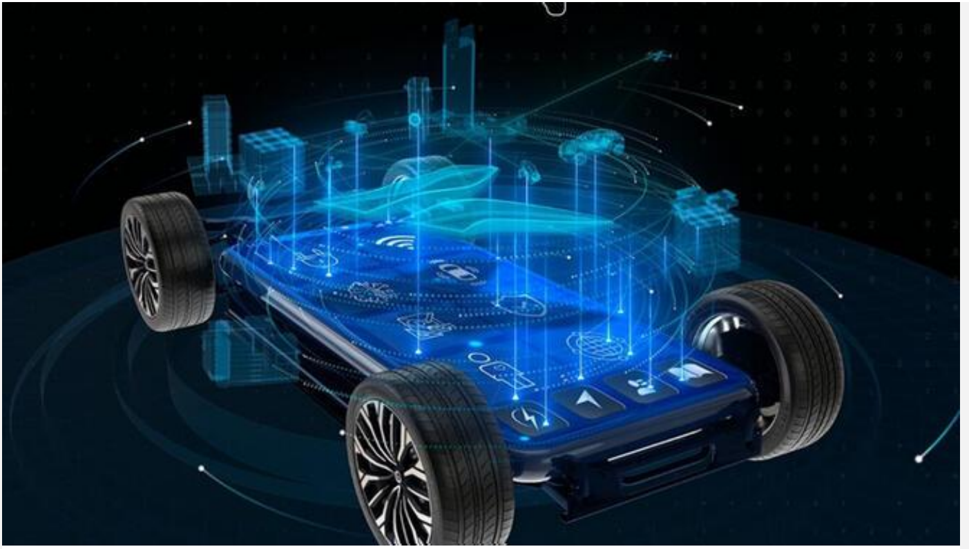
Togg, geleceğin girişimcileri için yol gösterici oluyor