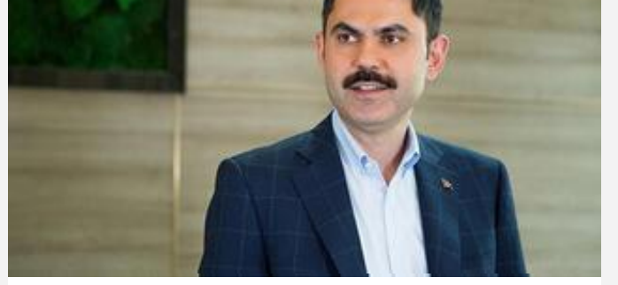
Bakan Kurum'dan iklim deęiřiklięiyle m¼cadele mesajı