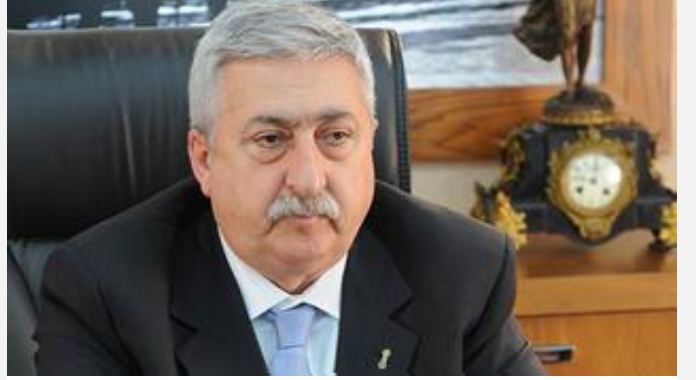
Palandöken: En fazla elektriği esnaf ödüyor