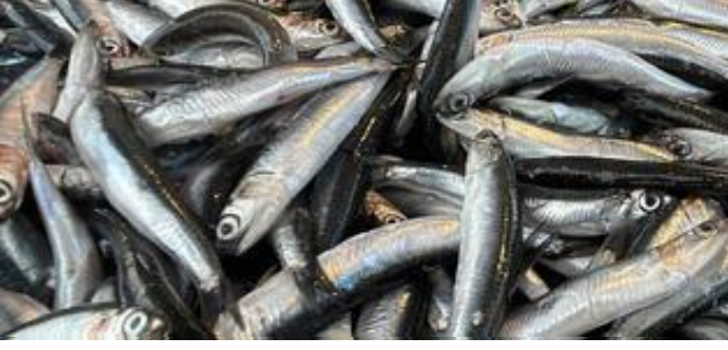
Tezgahlar hamsiyle dolup taşıyor