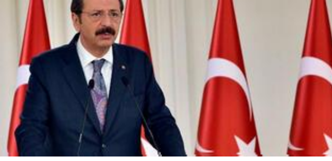
Hisacıklıoğlu: Türk tirlarının olumsuz etkilenmemesi için kriz masası oluşturduk