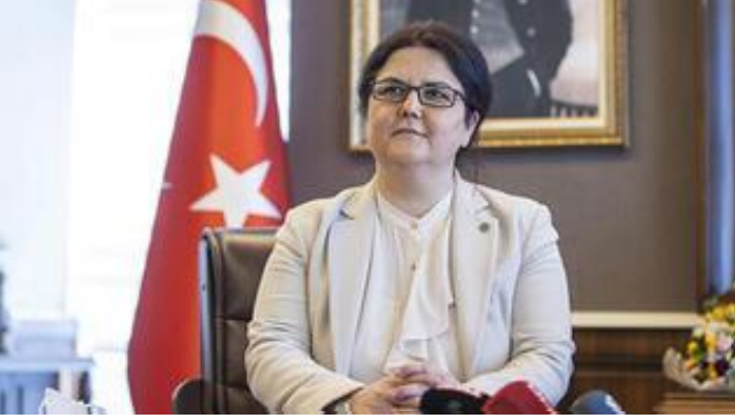
Bakan Yanık: Sosyal yardımları artırıyoruz