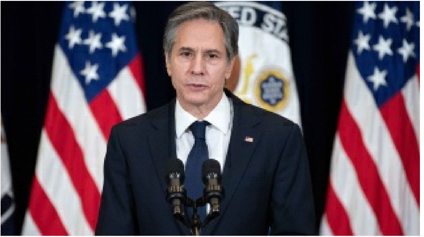
Blinken: atışma istemiyoruz ama buna hazırız