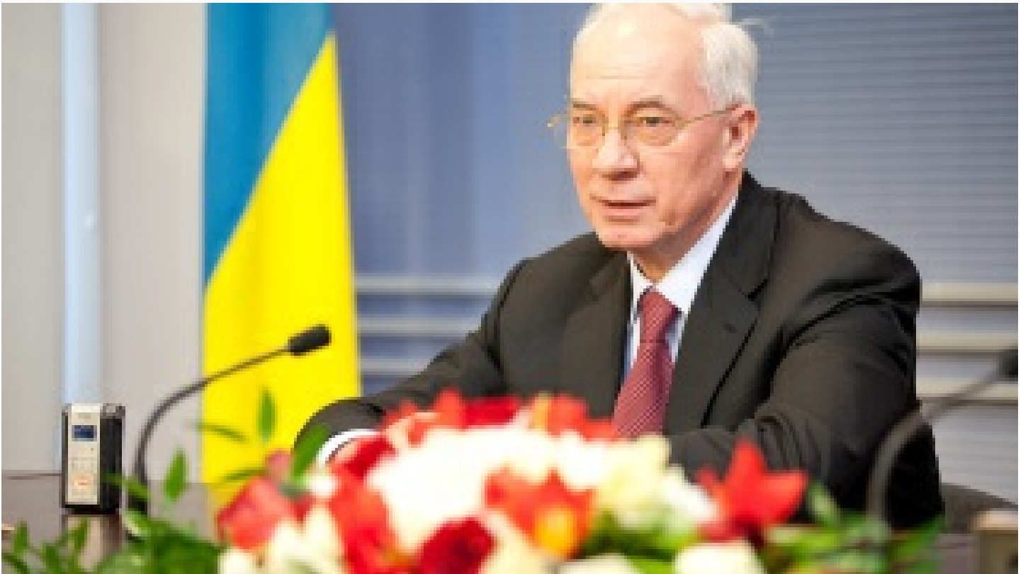
Eski Ukrayna Bařbakanı Azarov: Putin, Donbass'ta binlerce insanın hayatını kurtardı