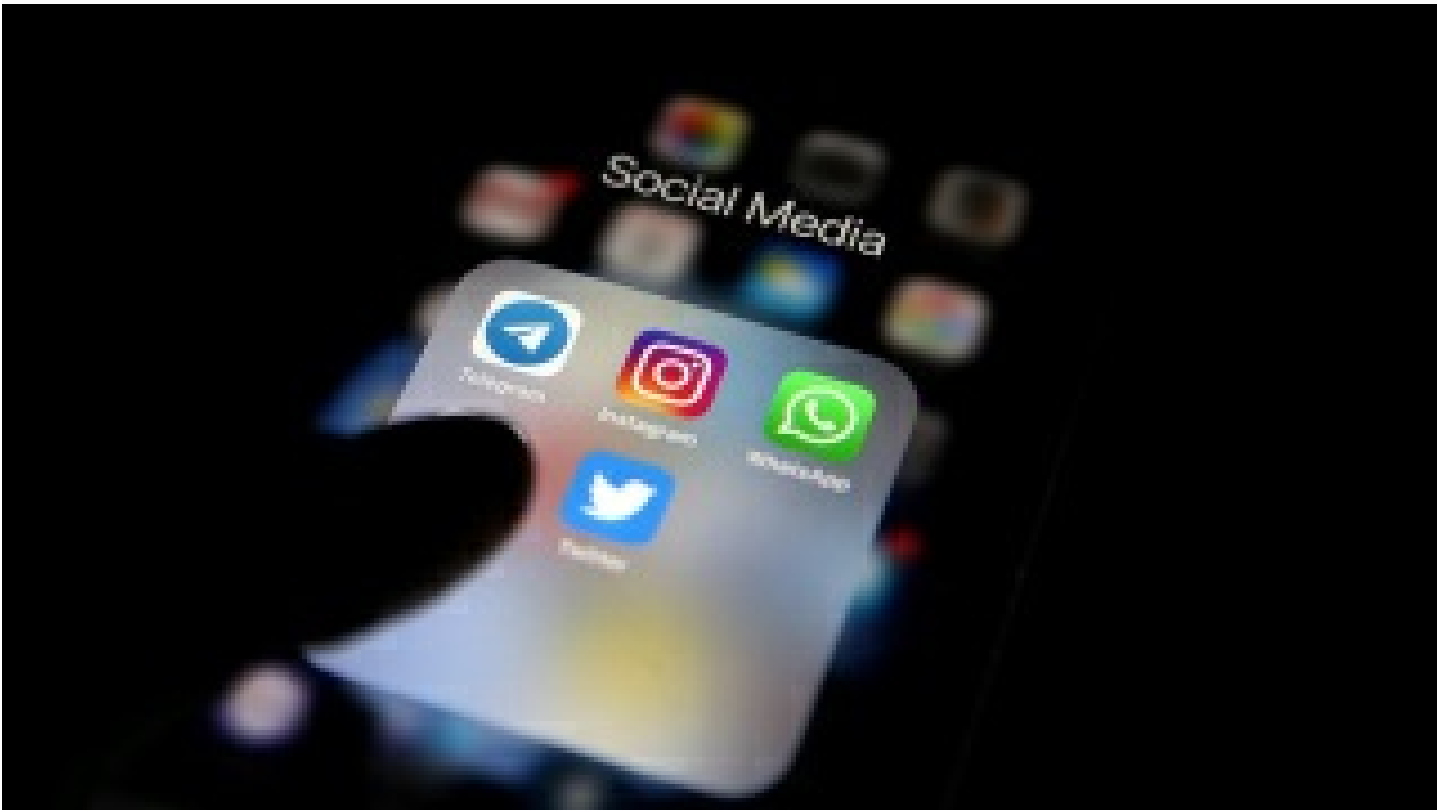
Rusya, ordu ile ilgili sahte bilgi paylaşmaya hapis cezası verebilecek