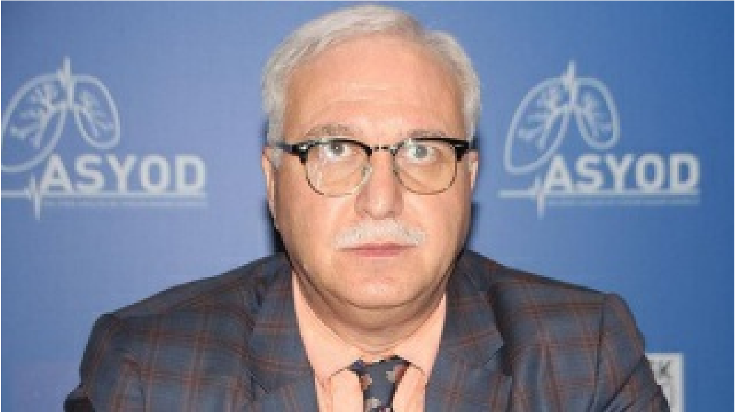
Prof. Özlü: Tam doz aşısızlar risk altında