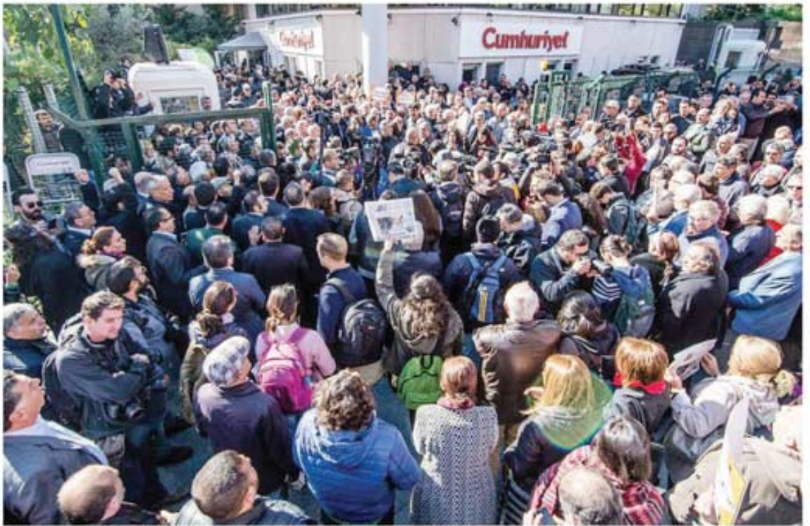
Yurttaşlar operasyonun ardından Cumhuriyet gazetesi önünde toplanarak basın özgürlüğüne sahip çıktı.

İktidarın basını susturma girişiminde yeni perde... Cumhuriyet gazetesini hedef alan operasyonda, gazetenin yazarları ve yöneticileri gözaltına alındı