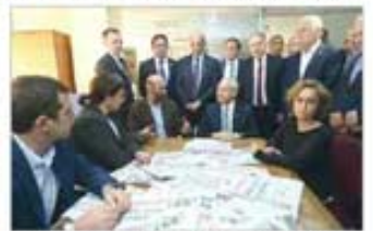
CHP Genel Başkanı Kemal Kılıçdaroğlu, Cumhuriyet Gazetesi Ankara Temsilcisi Erdem Gül'ü ziyaret etti