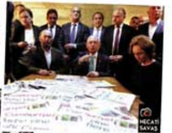
CHP Genel Başkanı Kılıçlaroğlu, Ankara Temsilcilerimizde destek ziyaretinde bulundu.

TGC, TGS, DİSK Basın-İş, Sınır Tanımayan Gazeteciler gibi basın meslek örgütleri gözaltılara kıyarak, gazetecilerin serbest bırakılmasını istedi. Türkiye'nin her yerinden birçok STK temsilcisi operasyonu kınadı, TCSDAD'dan yapılan açıklamada, basın dünyasının telette ilişkilendirilmesi eleştirildi.