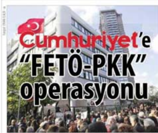
Cumhuriyet gazetesinin yapılan operasyon, gazete binası önünde toplanan grup tarafından protesto edildi.

İstanbul Cumhuriyet Başsavcılığına yürütülen soruşturma kapsamında Cumhuriyet gazetesine dün sabah operasyon gerçekleştirildi